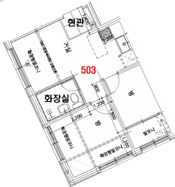
< 내부구조도 >