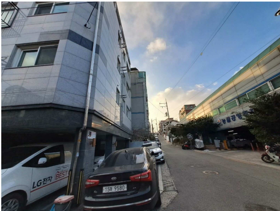
주위환경 및 인접도로