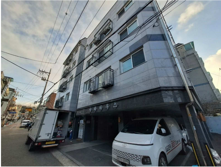
본건 건물 전경