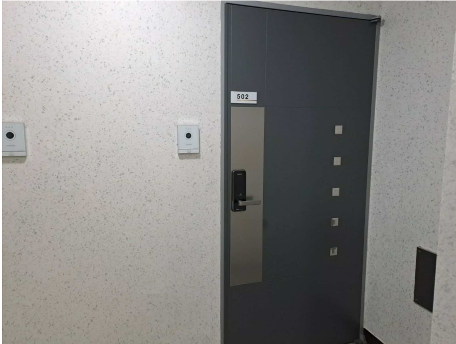
본건 기호(가) 전경