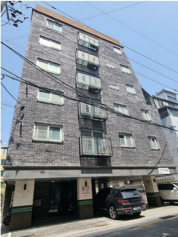
( ) 102