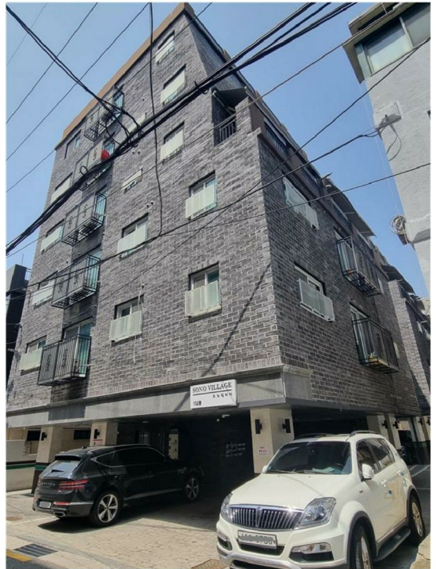
( ) 102