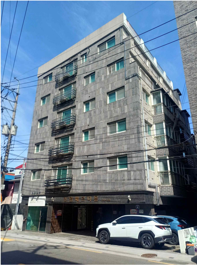
본건 소재 건물 남동측 저경