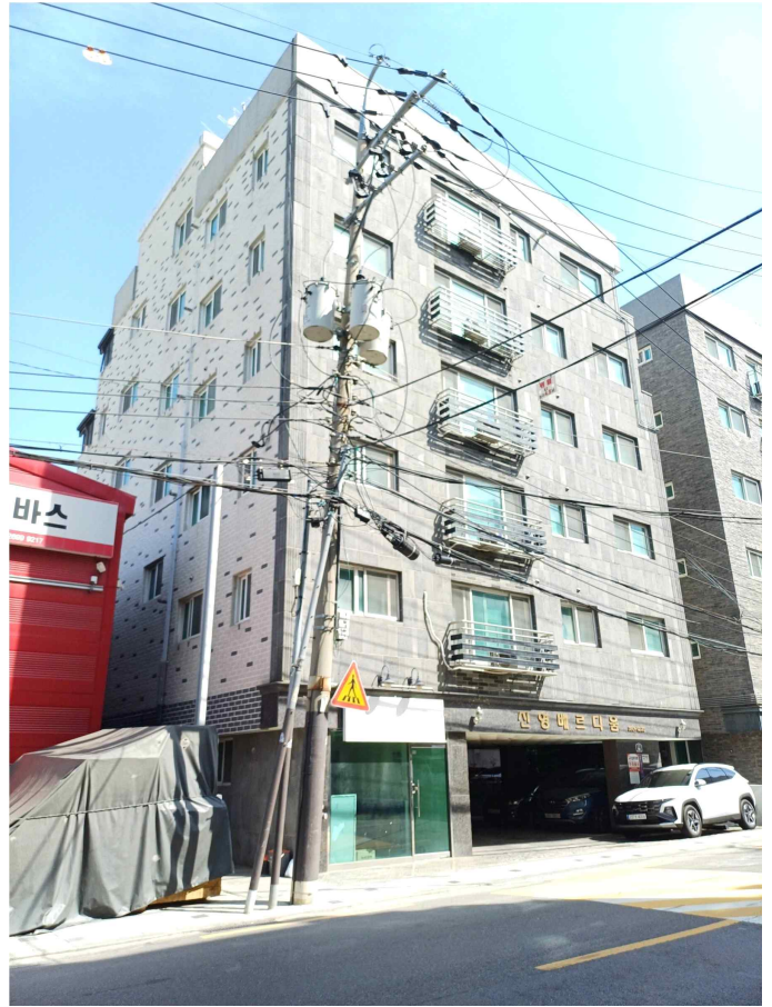
본건 소재 건물 남측 저경