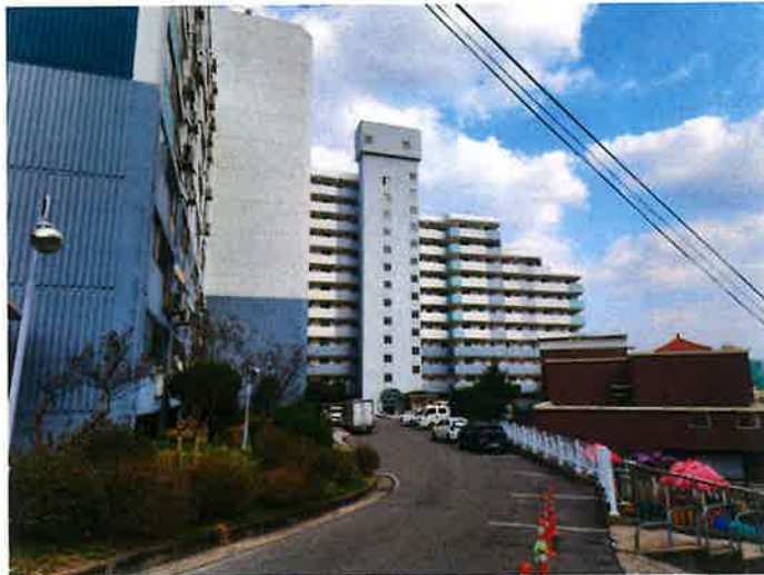
본건 103동 전경