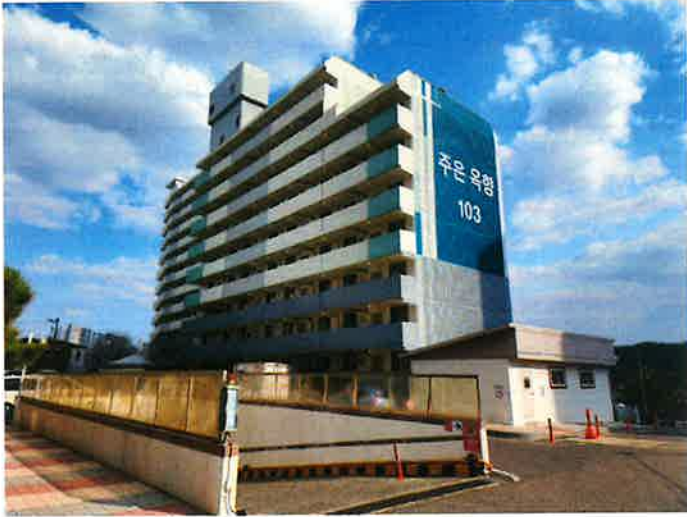
본건 103동 전경