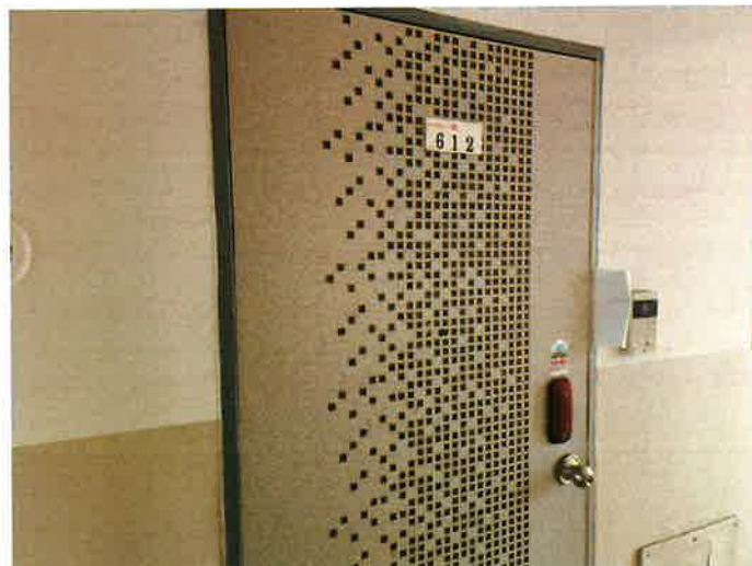
본건 전경 (현관)