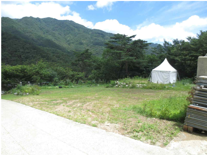
기호 2 토지 전경