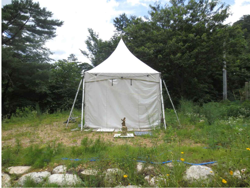
기호 2 토지 상의 텐트시설