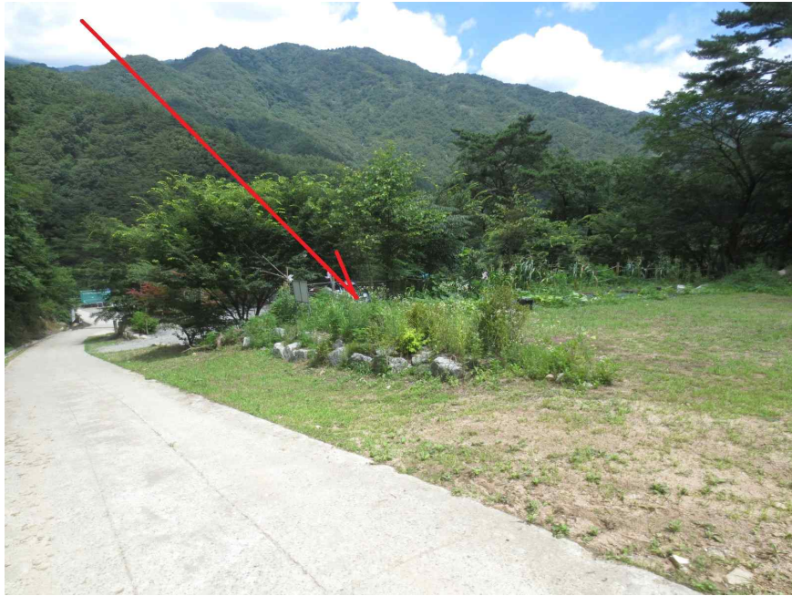
기호 1 토지 전경