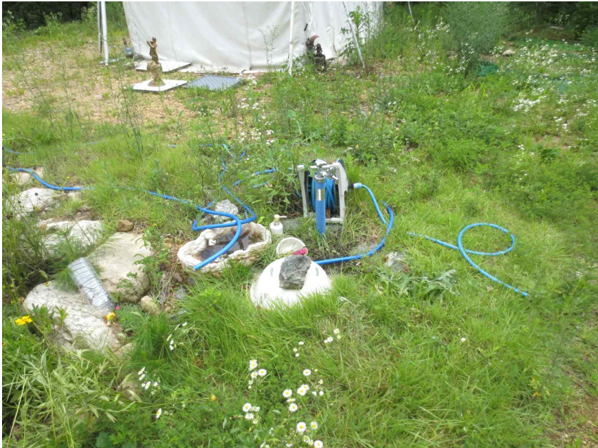
본건 토지 상의 수도시설