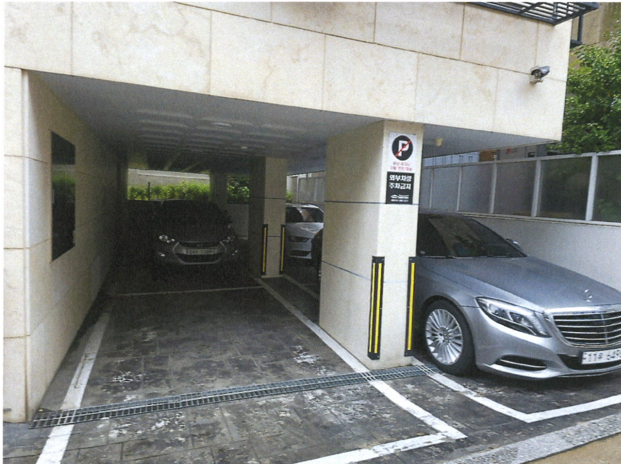
본건동 주차장 전경