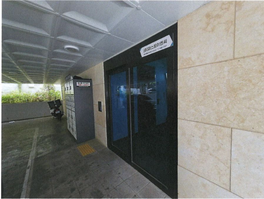
본건동 주출입구 전경