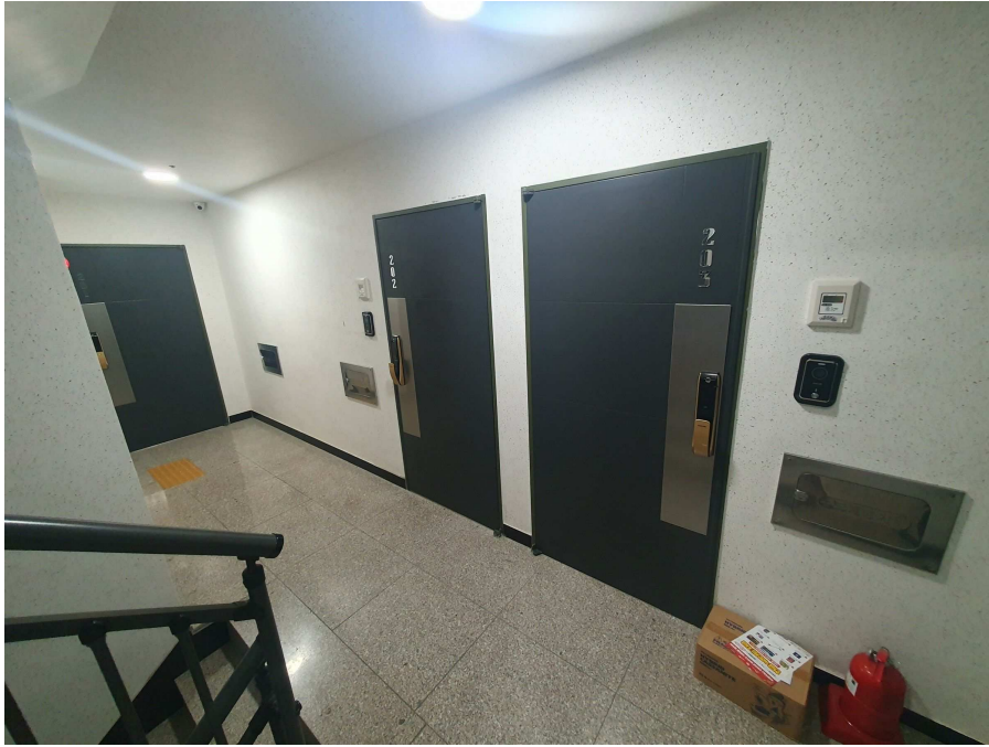
본건 앞 복도 전경