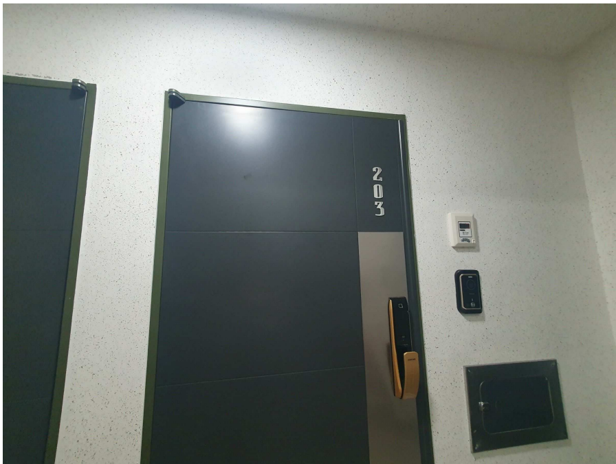
본건 호수 출입문