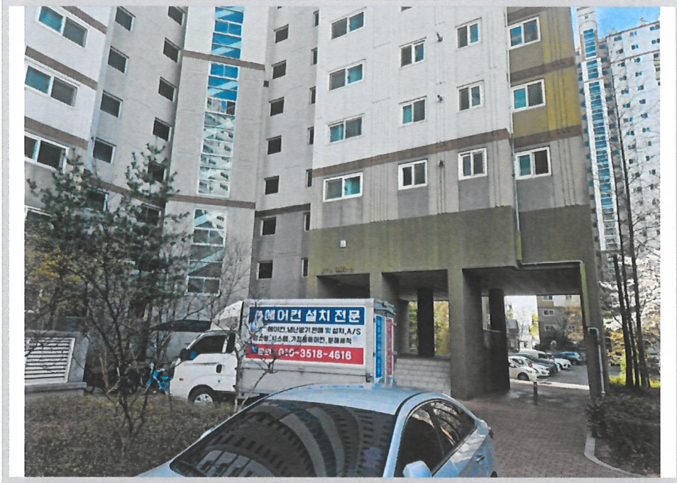
본건 입구 전경