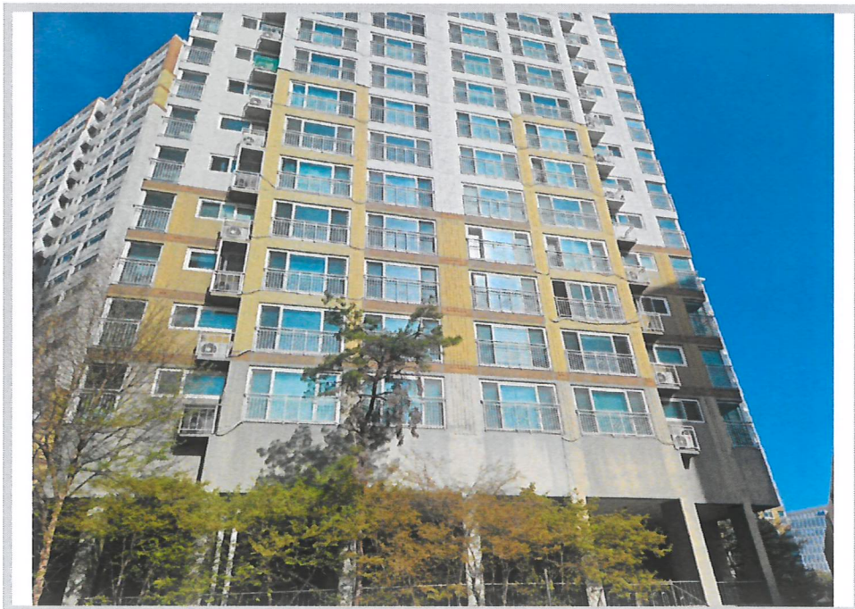
본건 전경 (남동측에서 촬영)