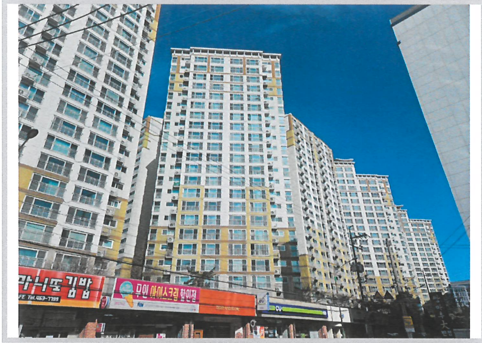
본건 전경 (남동측에서 촬영)