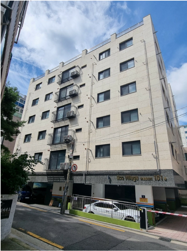
( ) 101