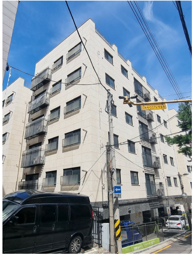
( ) 101