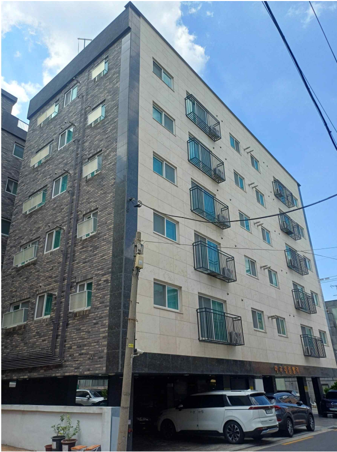
본건 소재 건물 남동측 전경