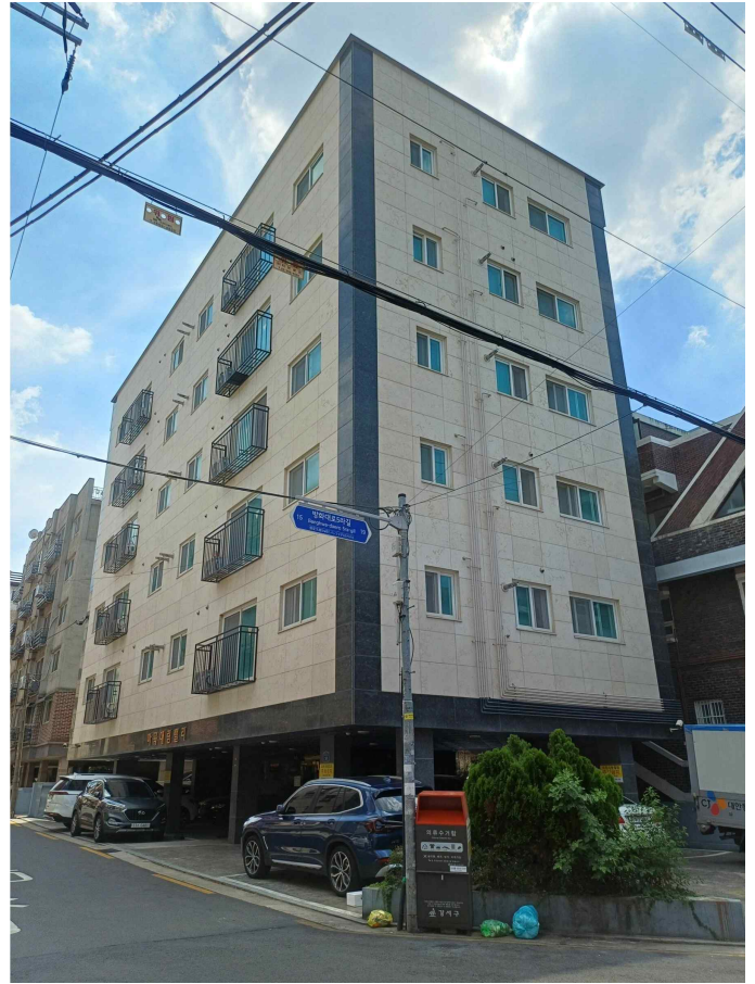
본건 소재 건물 북동측 전경