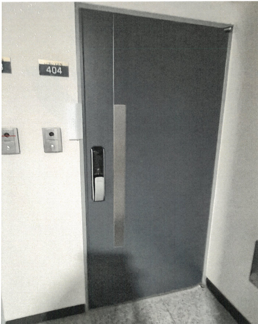
<본건 현관 전경>