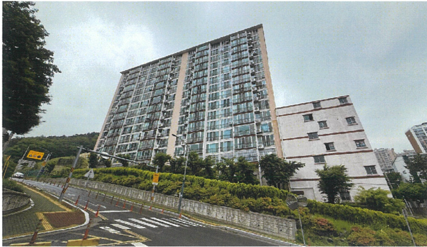
본건 및 주변환경