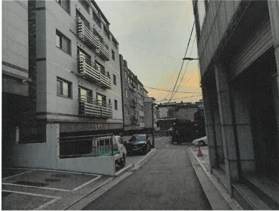
접면도로 및 주위환경(북동측에서 촬영)