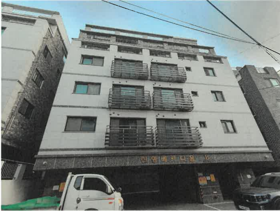
본건 소재 건물 전경