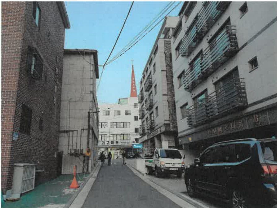
접면도로 및 주위환경(북서측에서 촬영)