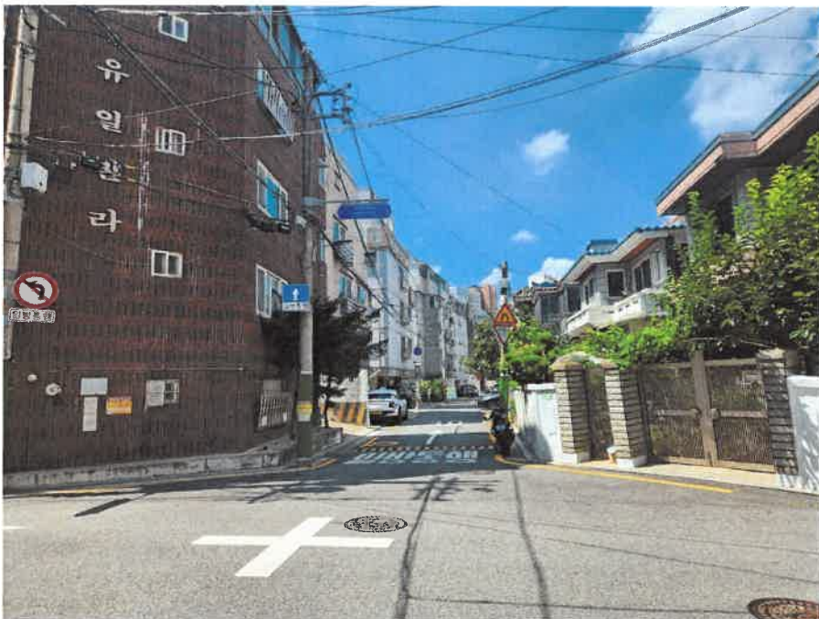
본건 주위환경(북동측 도로)