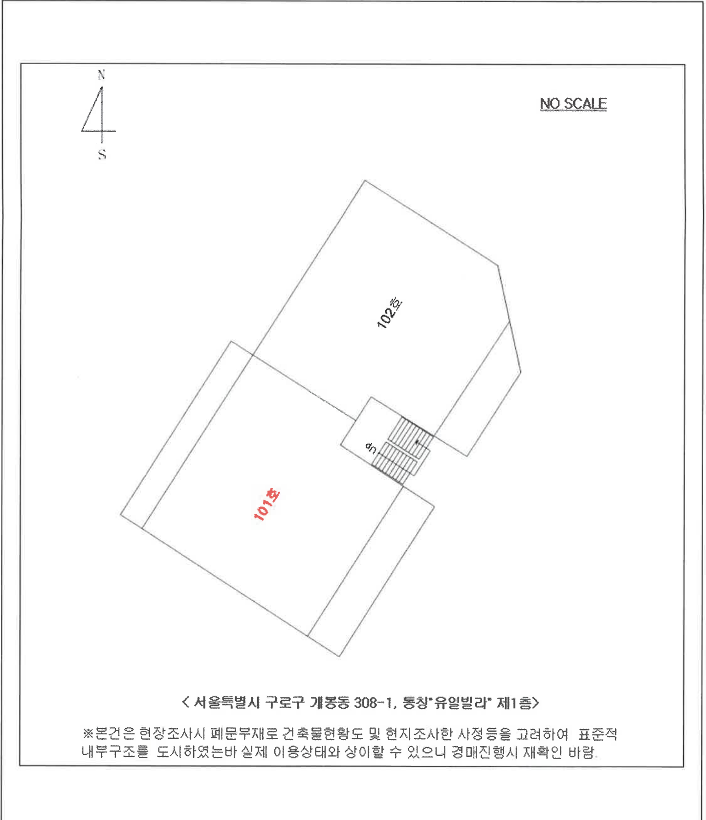
< 서울특별시 구로구 개봉동 308-1, 통칭'유일빌라' 제1층 >

※본건은 현장조사시 폐문부재로 건축물현황도 및 현지조사한 사정등을 고려하여 표준적 내부구조를 도시하였는바 실제 이용상태와 상이할 수 있으니 경매진행시 재확인 바람.