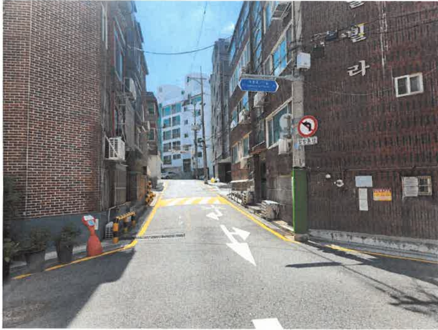
본건 주위환경(남동측 도로)