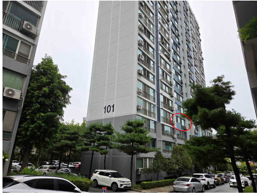
본건 전경(남서측에서 촬영)