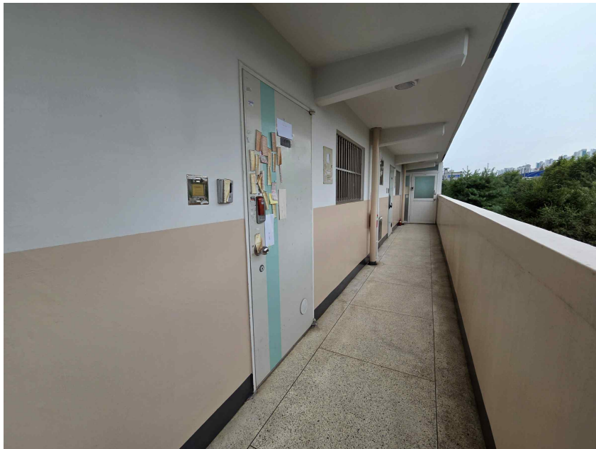
본건 현관 및 4층 복도