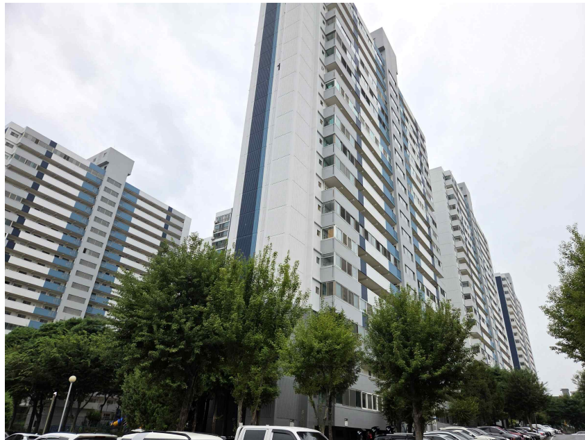
본건 전경(북동측에서 촬영)