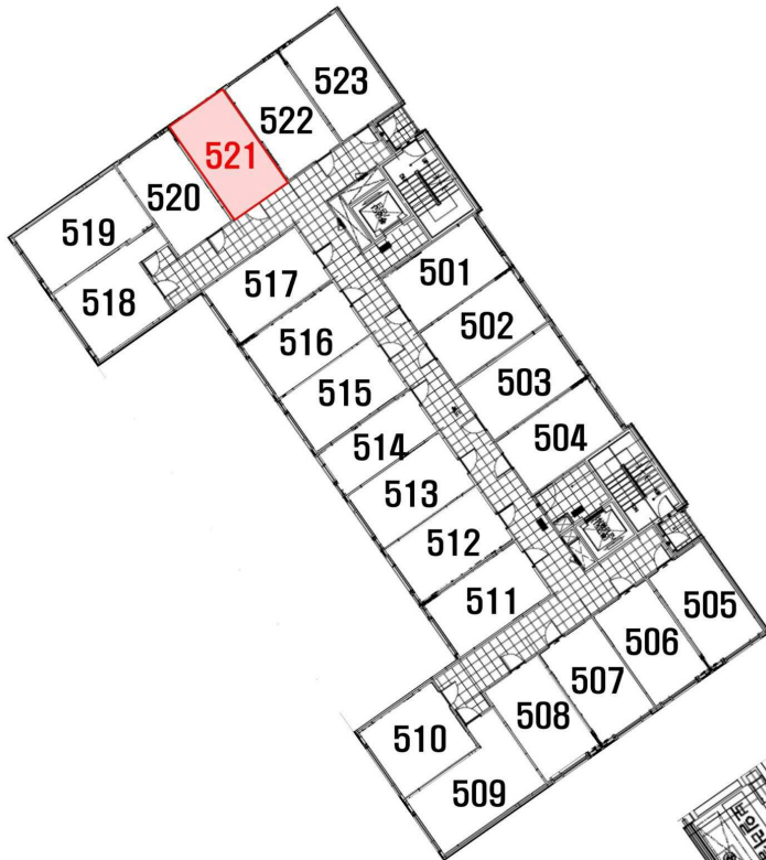
< 호별배치도 >