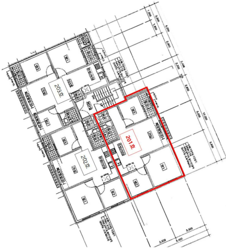
축척없음 <호별배치도 및 내부구조도>