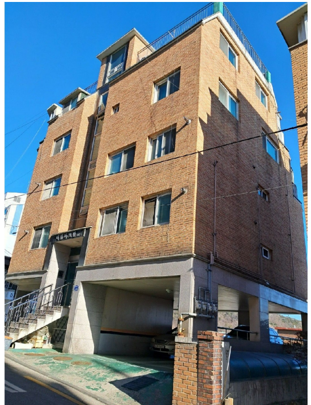
( : )