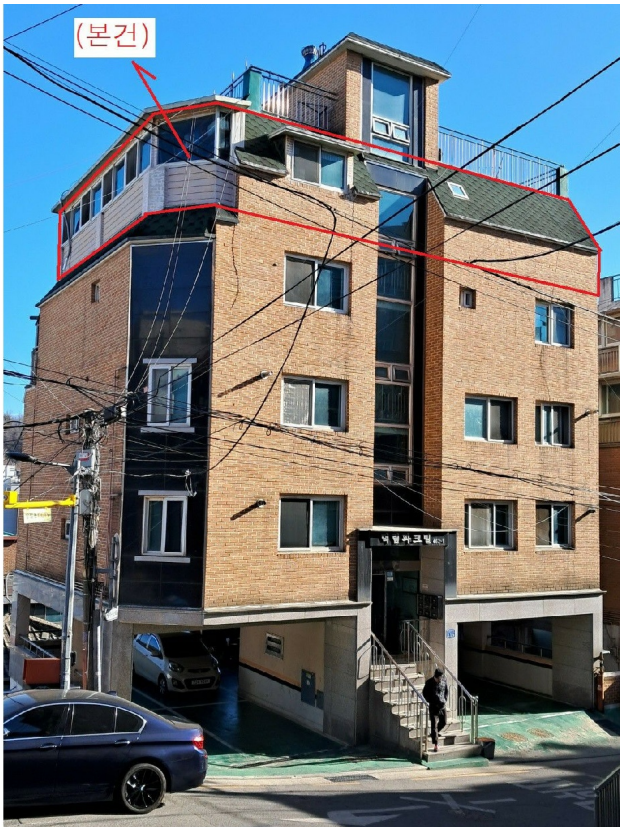
( : ) 5 501