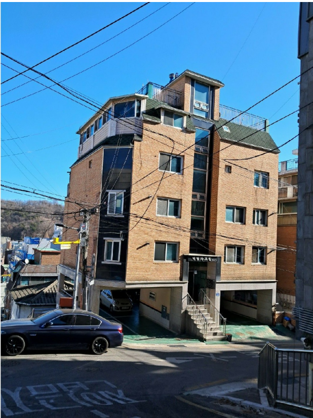
( : )