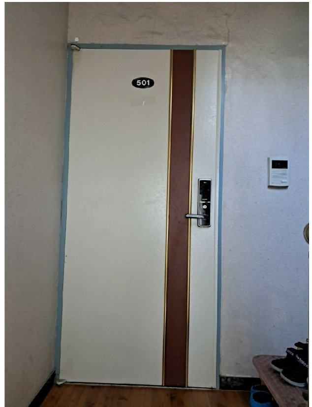
( : ) 5 501