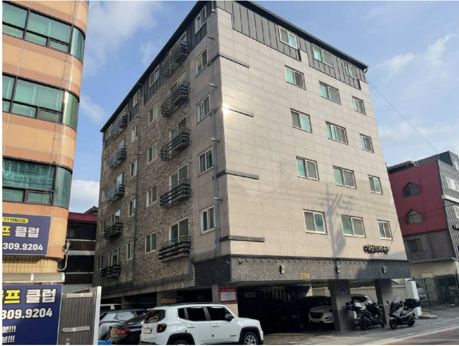
본건소재 건물 북측 전경