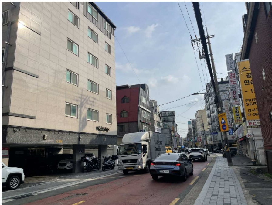
본건 북서측 주위환경