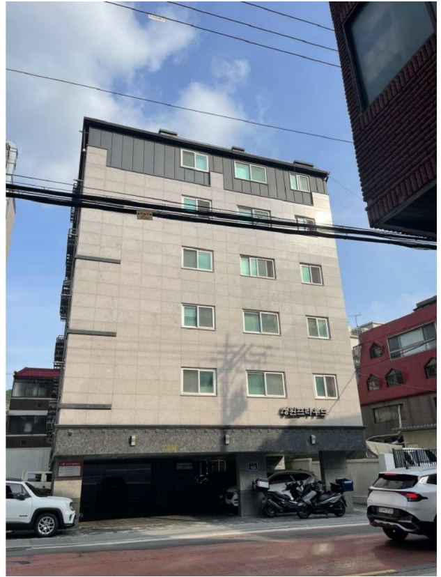
본건 소재 건물 전경