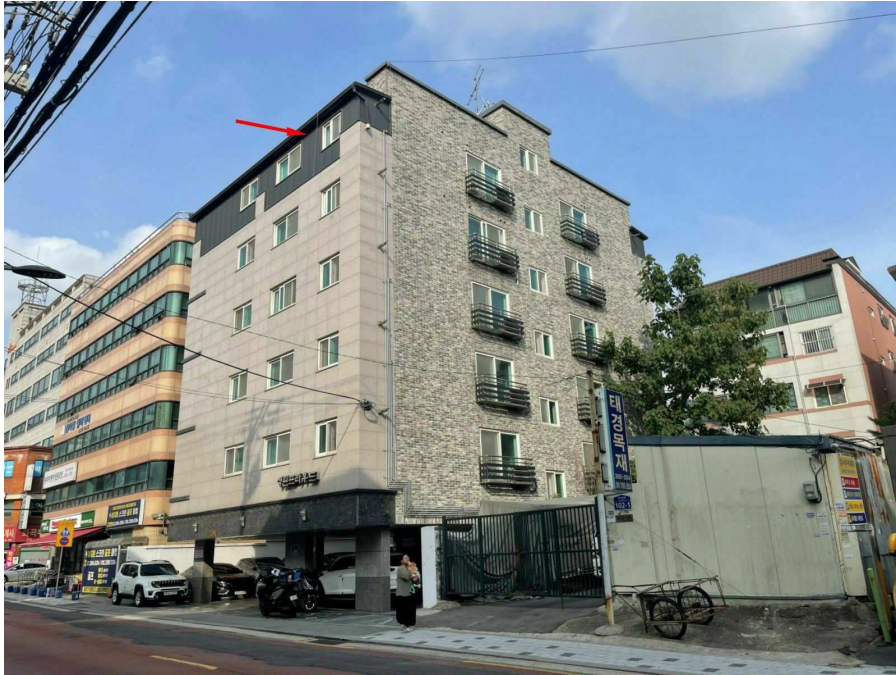
본건 및 제시외건물 (ㄱ) 전경