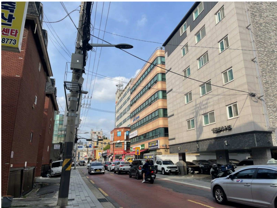
본건 소재 건물 접면도로 및 주위환경