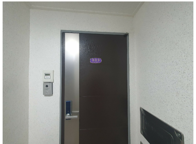
( 303 )