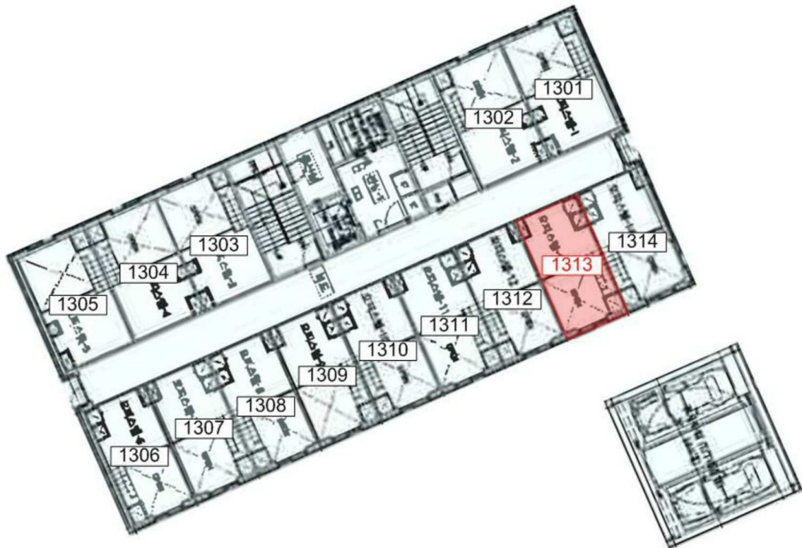
< 본건 선유도역마들렌오피스텔 제13층 호별배치도 >

서울특별시 영등포구 양평동5가 24-1 선유도역마들렌오피스텔 제13층 제1313호