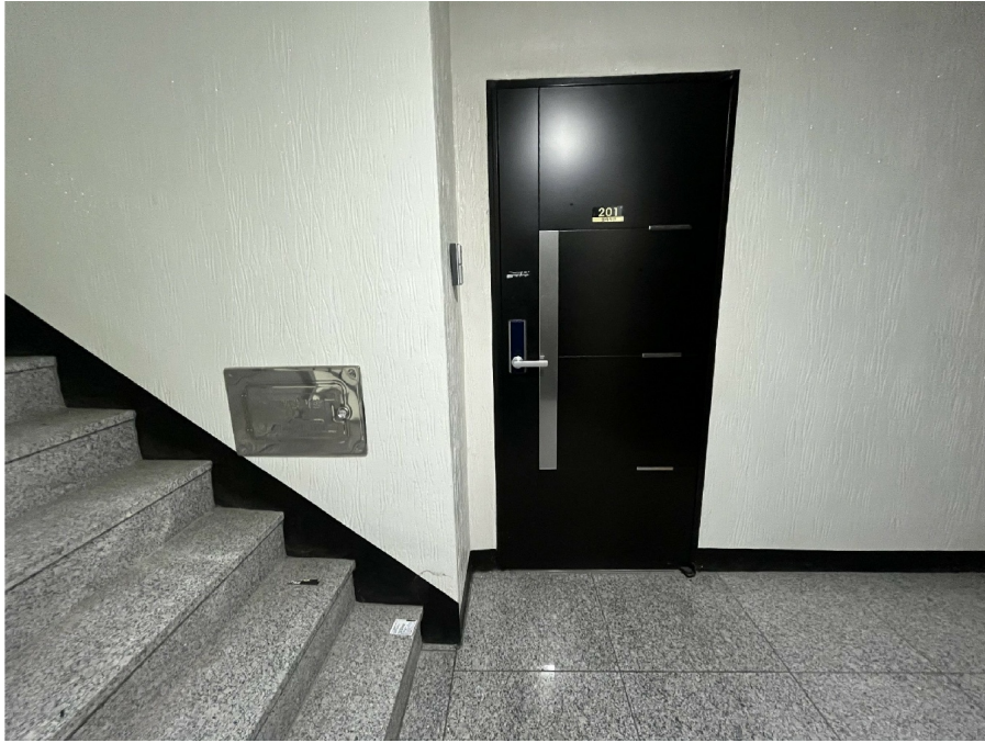
' ( 201 ) '