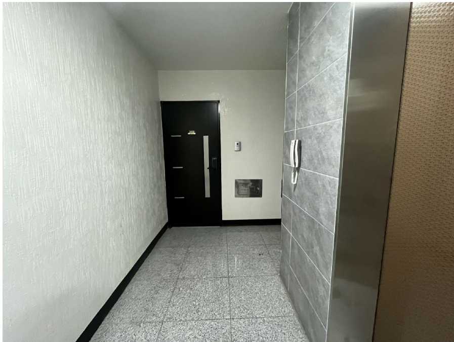
' ( 202 ) '