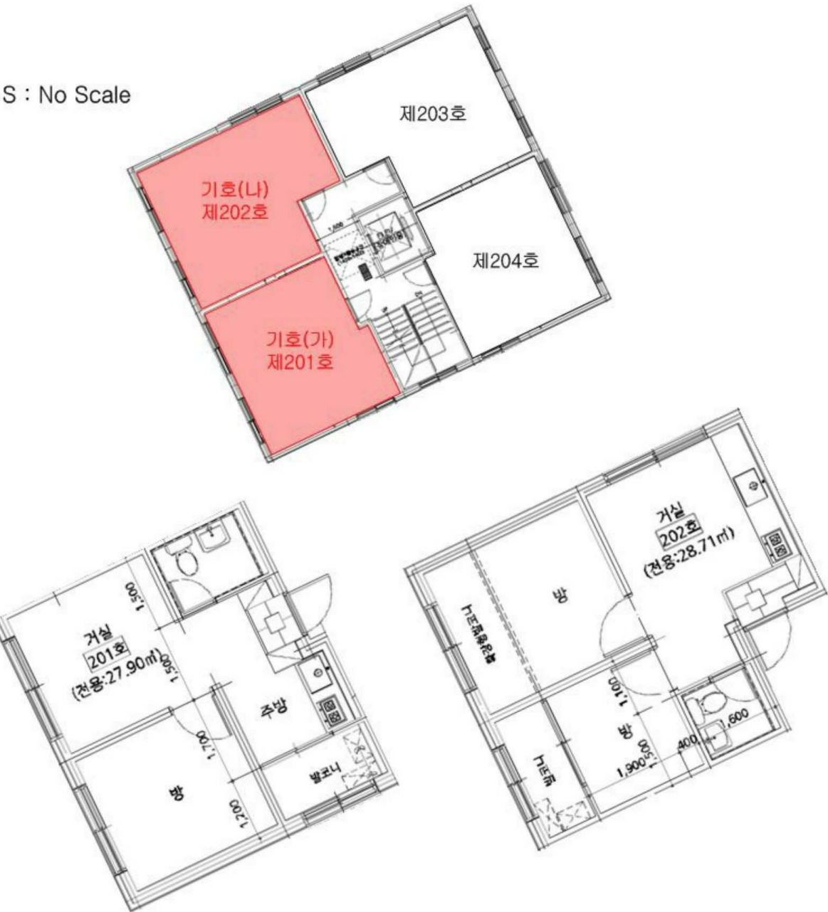
< 제2층 호별배치도 및 제201호, 제202호 내부구조도 >