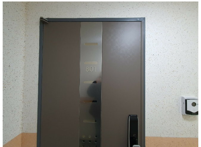
( 801 )