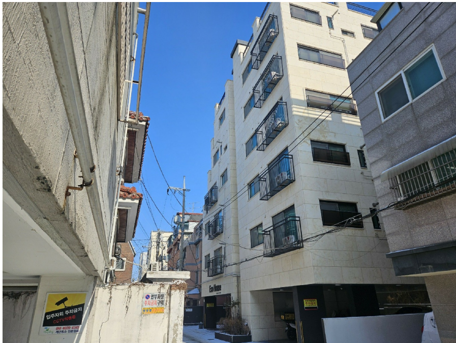
< 2 >