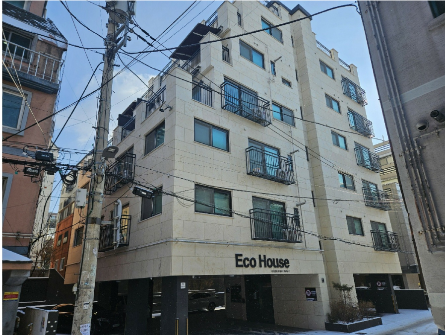
< 1 >