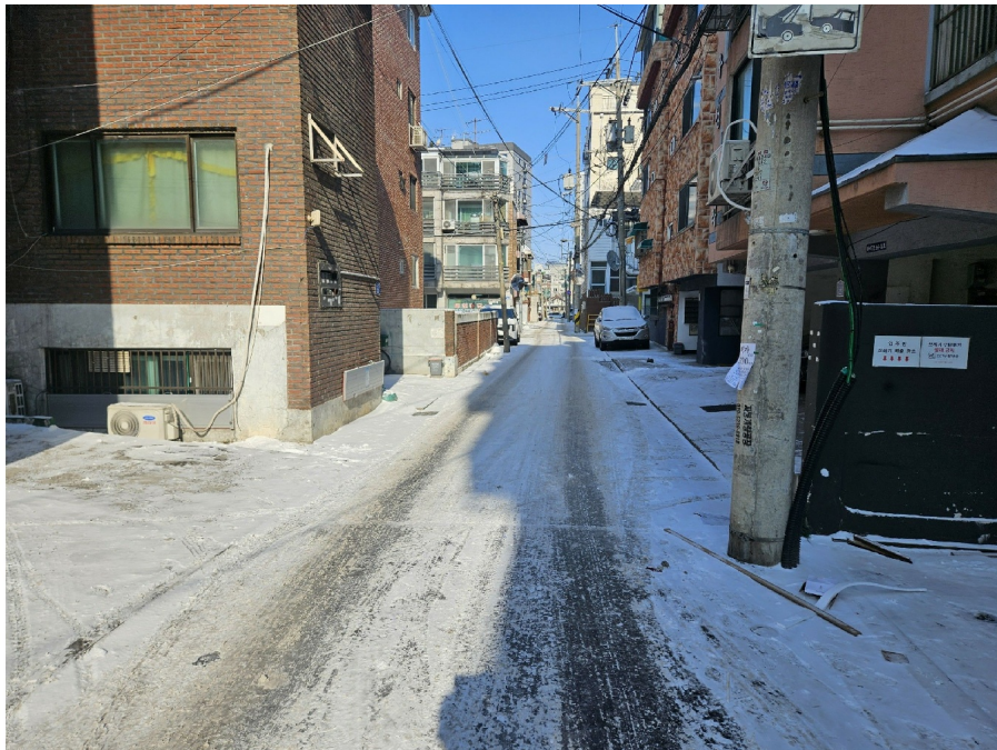
< 2 >