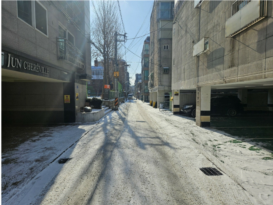
< 1 >