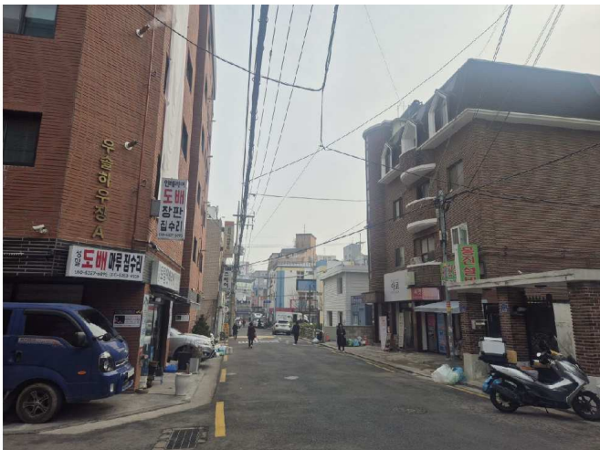
대상물건의 속한 건물의 주위전경