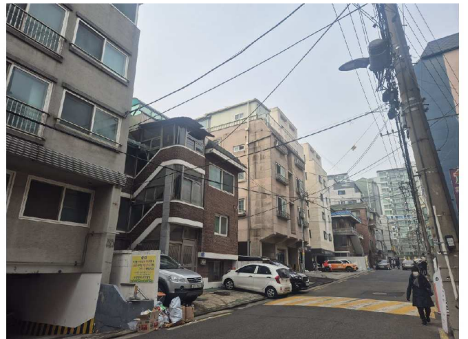
대상물건의 속한 건물의 주위전경