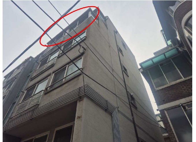
대상물건의 속한 건물 및 제시외건물 전경