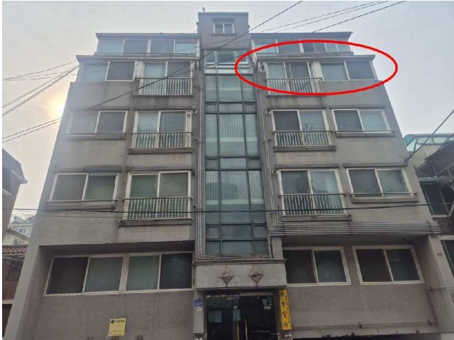
대상물건의 속한 건물 및 제시외건물 전경