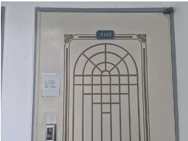
일련번호 1) 출입구 전경