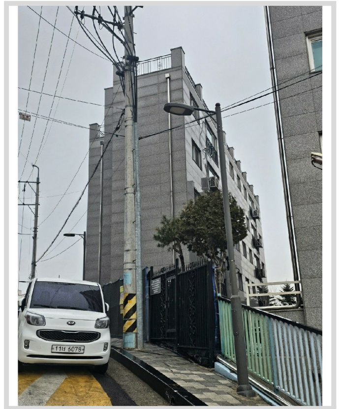
[ 108 ]