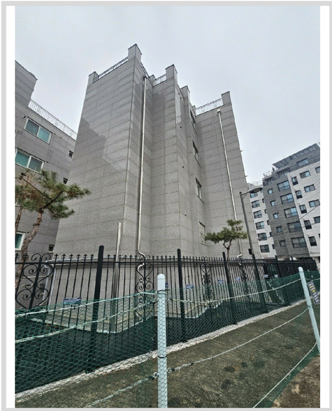
[ 108 ]