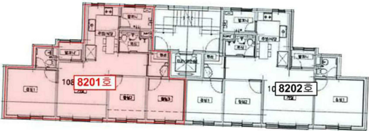
< 본건 로제트힐 제108동 제2층 호별배치도 >

소재지 서울특별시 구로구 공동 292 외 2필지 로제트힐 제108동 제2층 제8201호