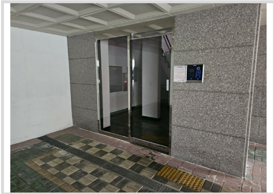
[ 108 ]