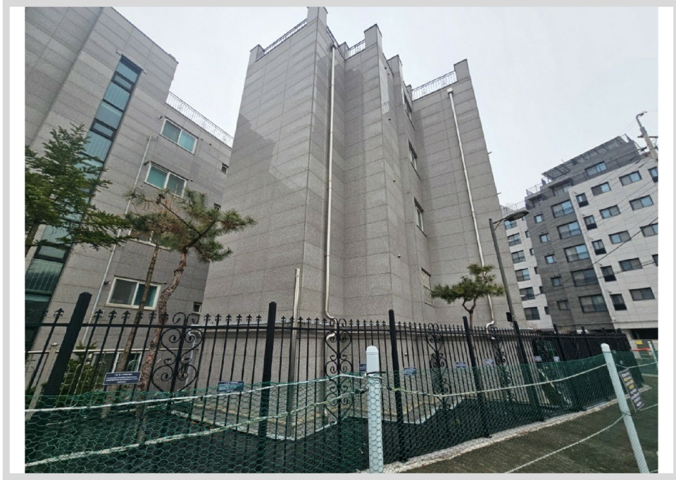
[ 108 ]