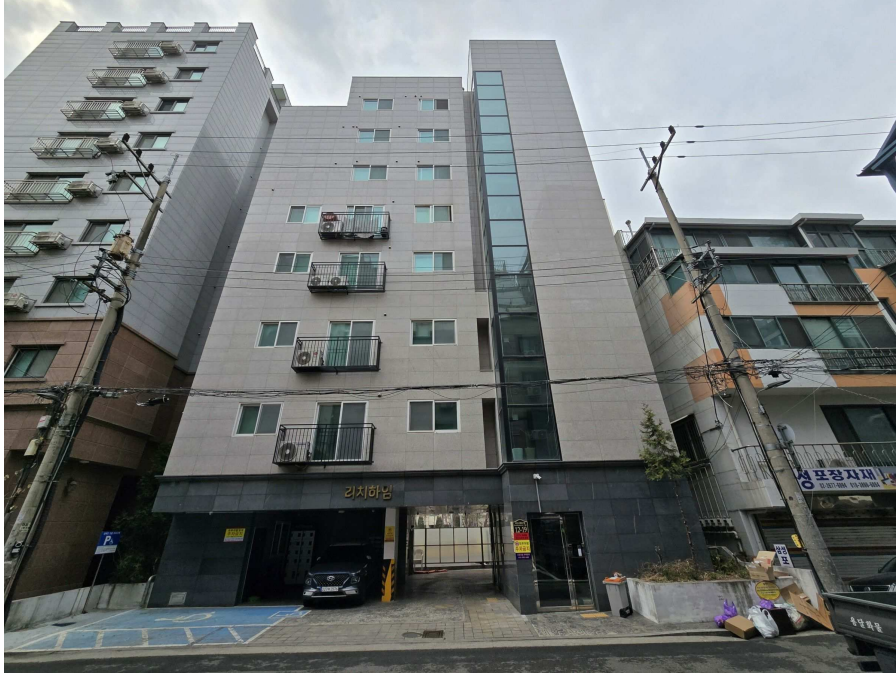
본건 건물 전경