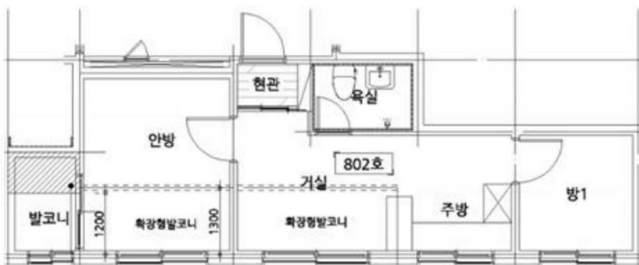
< 제8층 호별배치도 및 제802호 내부구조도 >