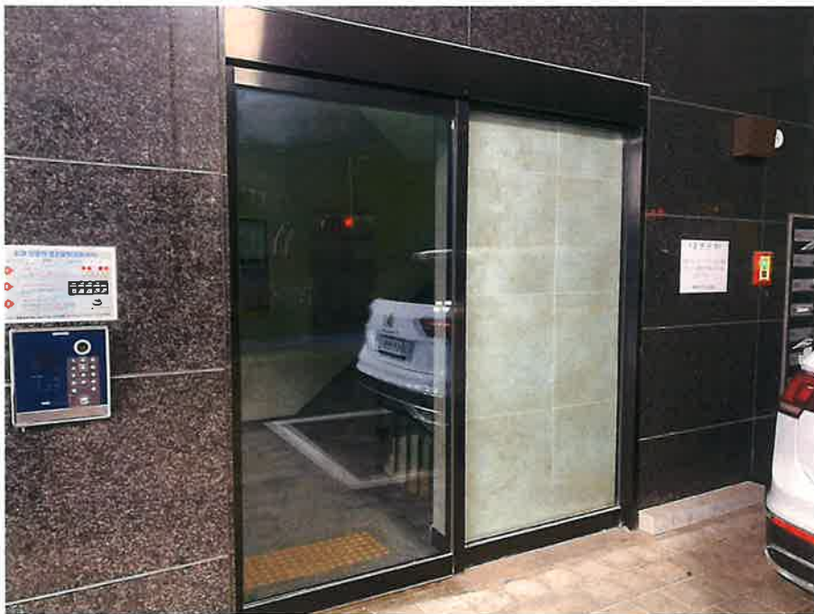
공동 현관문 전경