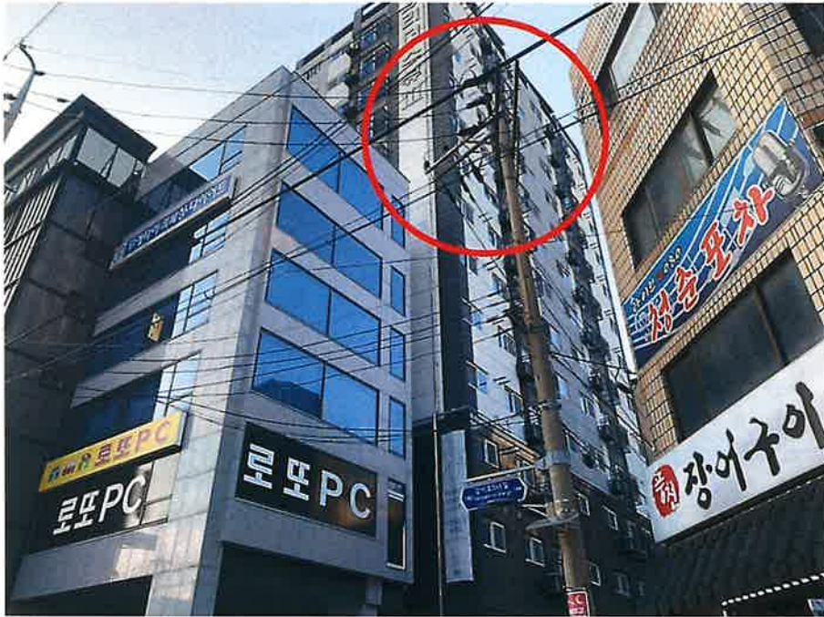
본건 외관 전경