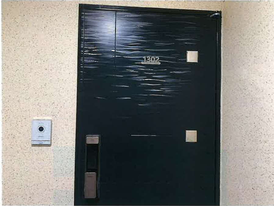
본건 현관 전경