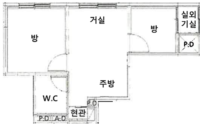
< 내 부 구 조 도 >