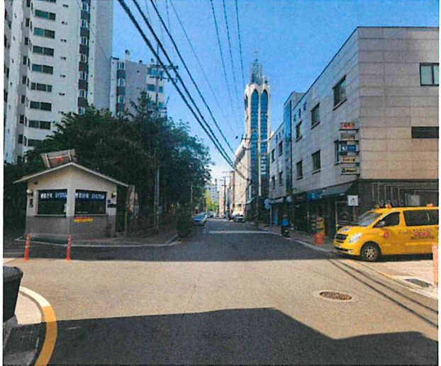
[ 주위 전경 ]