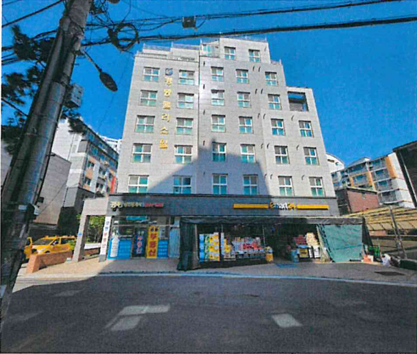
[ 대상물건 전경 ]