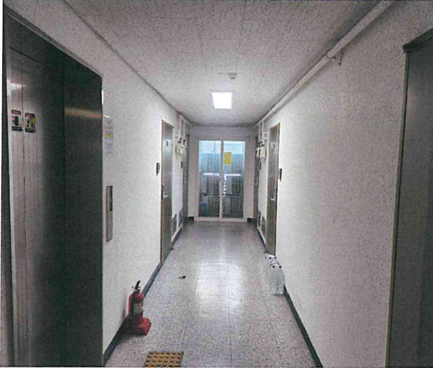
[ 제5층 복도 전경 ]