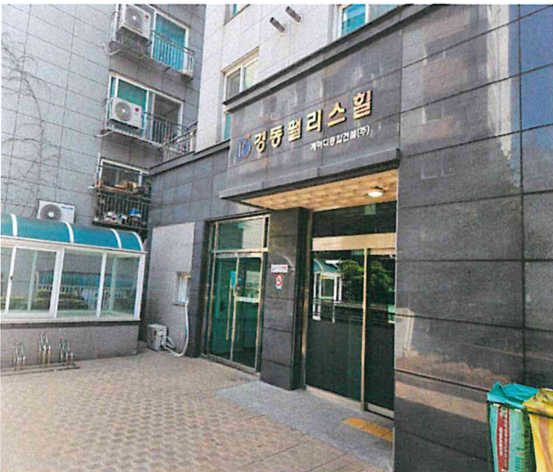
[ 공동출입구 전경 ]