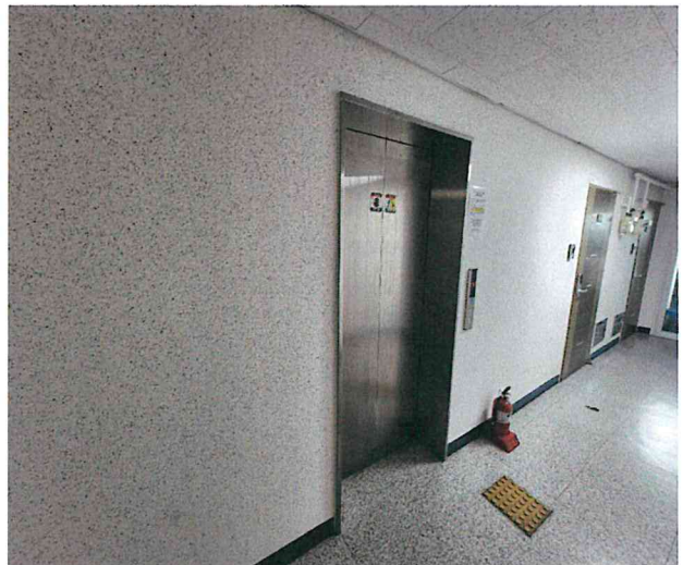
[ 엘리베이터 전경 ]