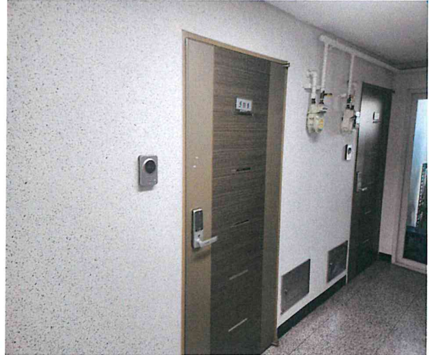
[ 출입문 전경 ]