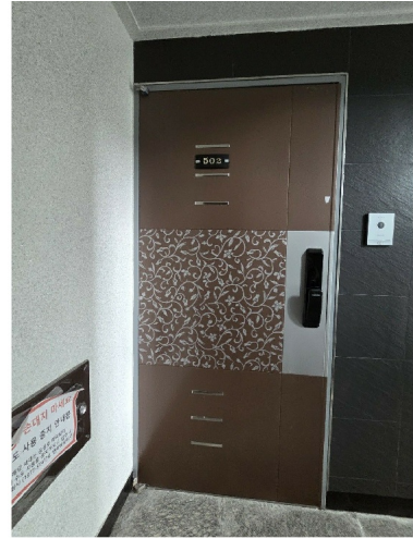
( 502 )