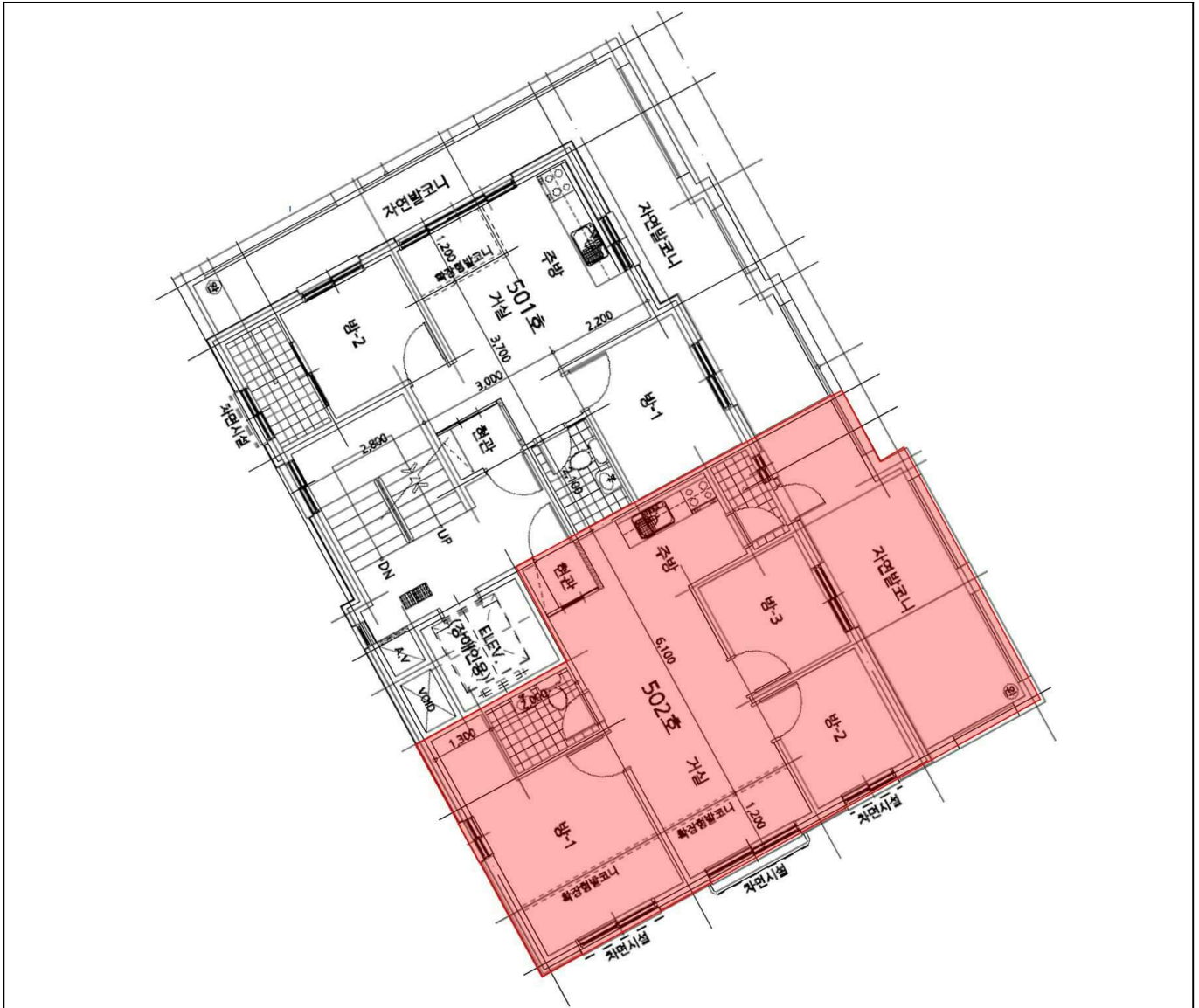
5층 502호 내부구조도

소재지 서울특별시 강서구 화곡동 504-9 누리에스.에이치.티 제1동 제5층 제502호