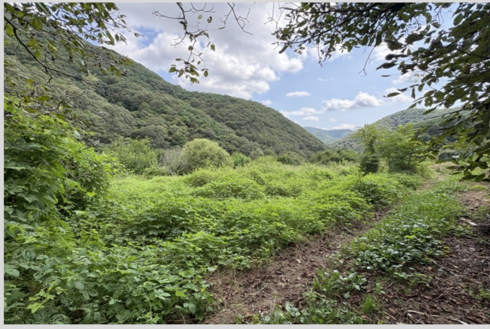
【본건 북측에서 촬영한 전경】