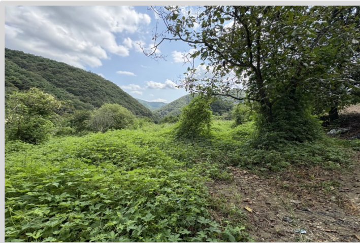
【본건 서측에서 촬영한 전경】