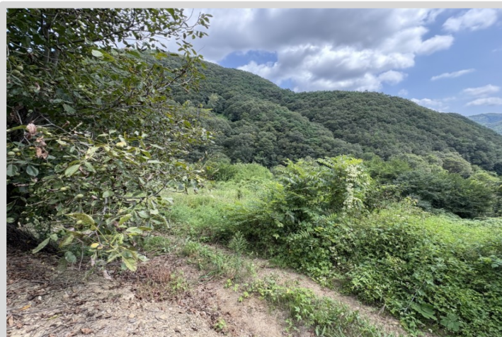
【본건 남측에서 촬영한 전경】