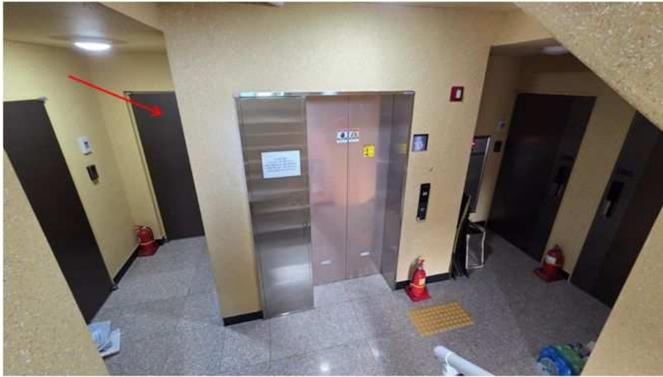
10층 복도 전경