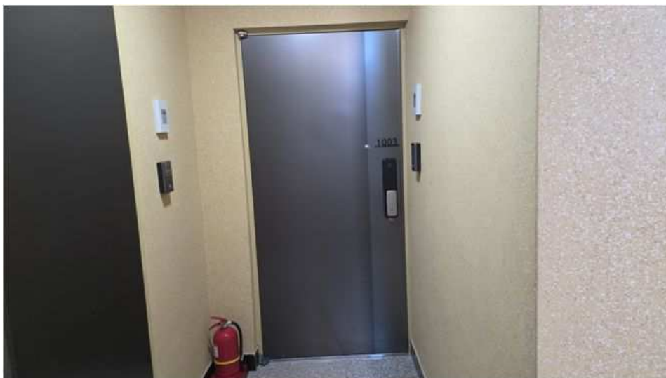
본건 1003호 전경