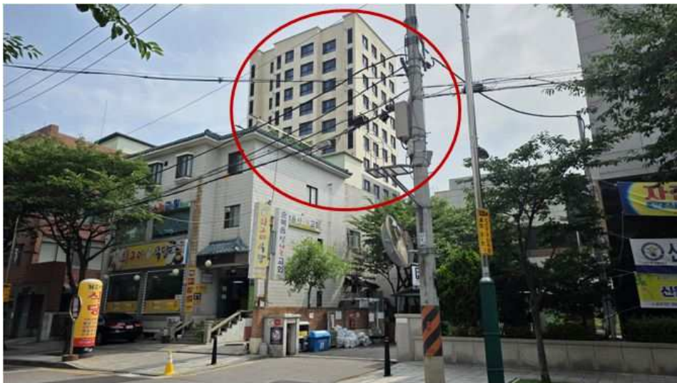
본건이 속한 건물 후면 전경