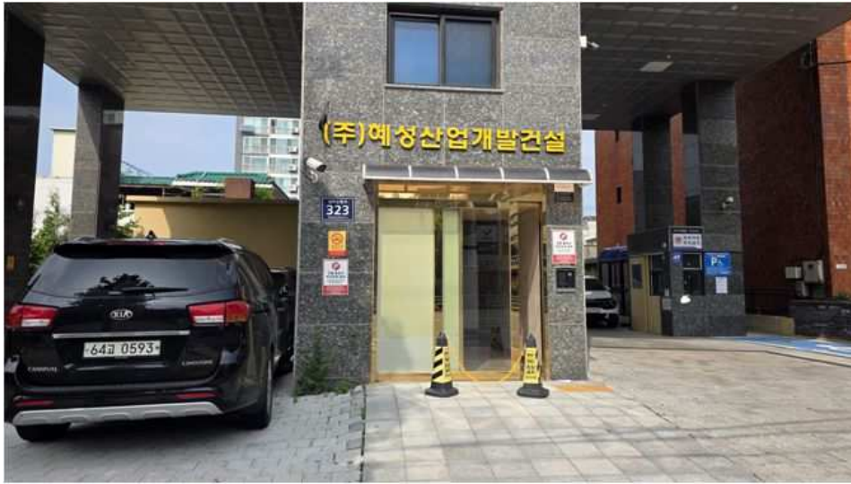
1층 주출입구 전경