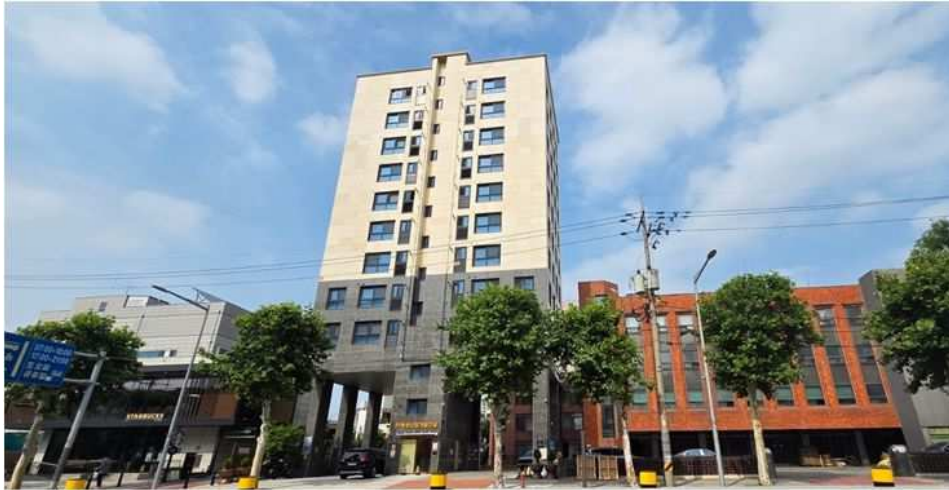
본건이 속한 건물 전면 전경