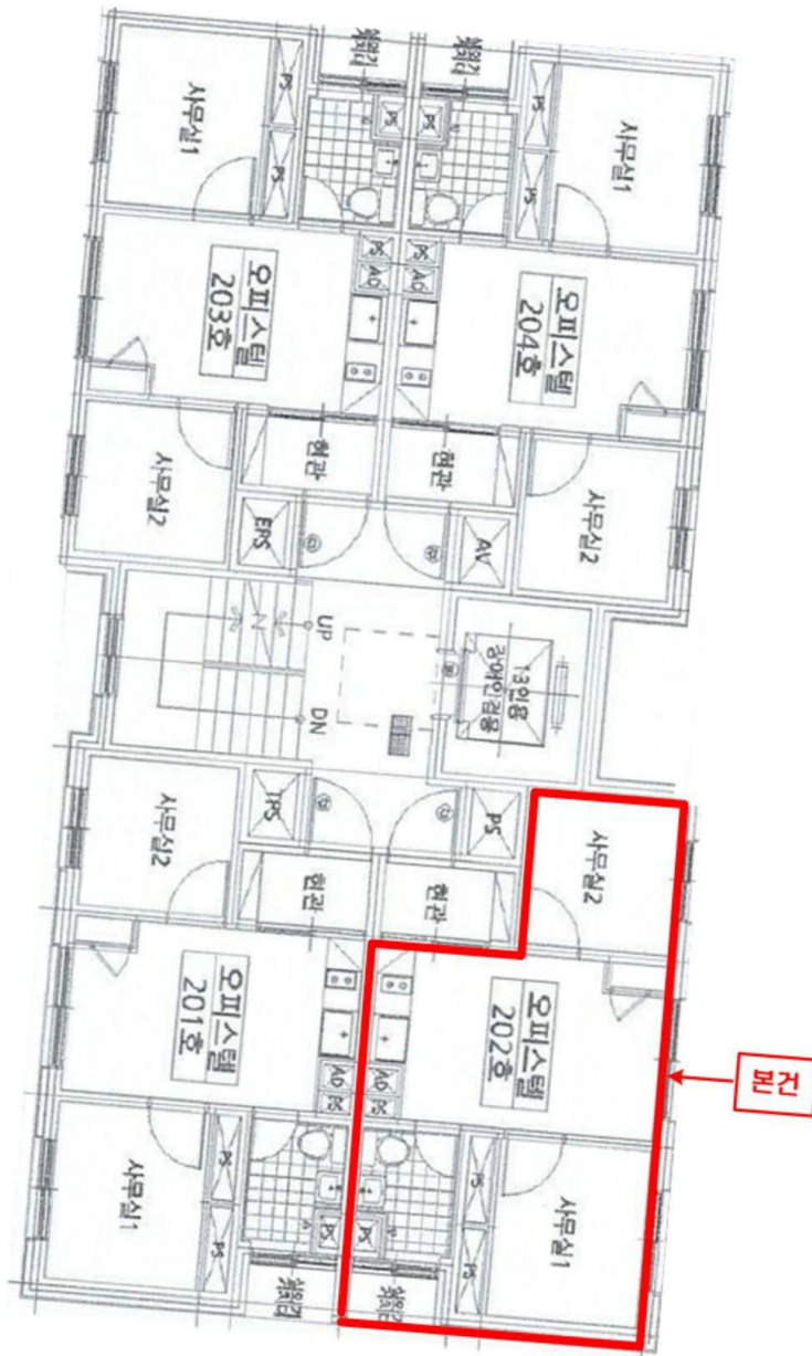
〈호별배치도 및 내부구조도〉

소재지 서울특별시 강서구 염창동 261-16 루미온 제101동 제2층 제202호