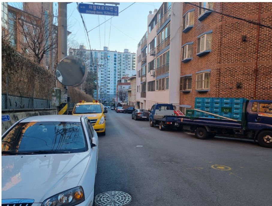
인근도로 및 주위환경