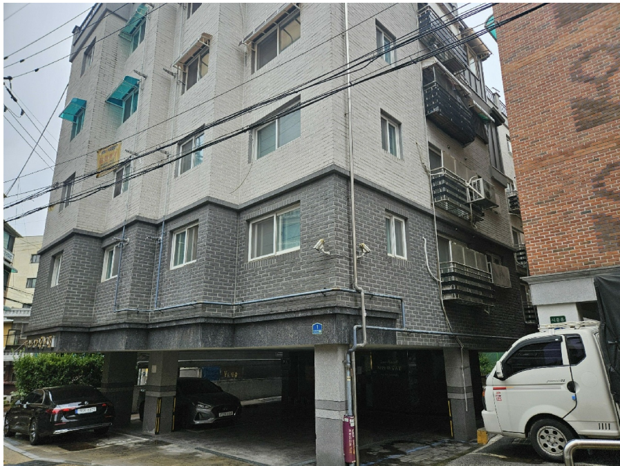
< 2 >