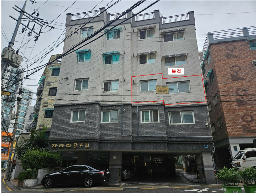
< 1 >