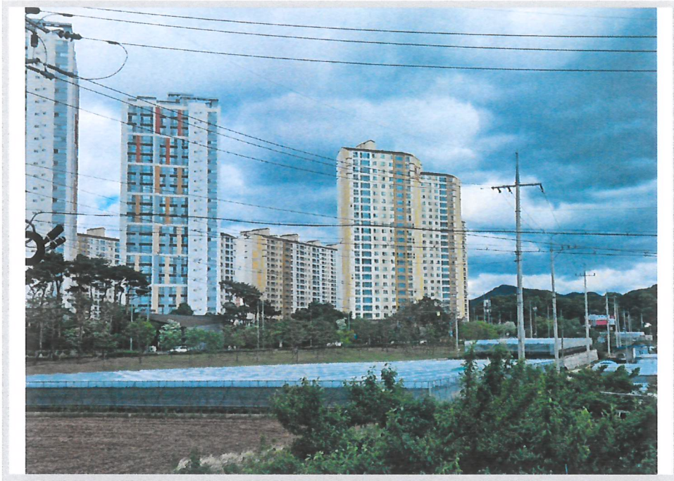
본 단지 전경 (남서측 인근에서 촬영)