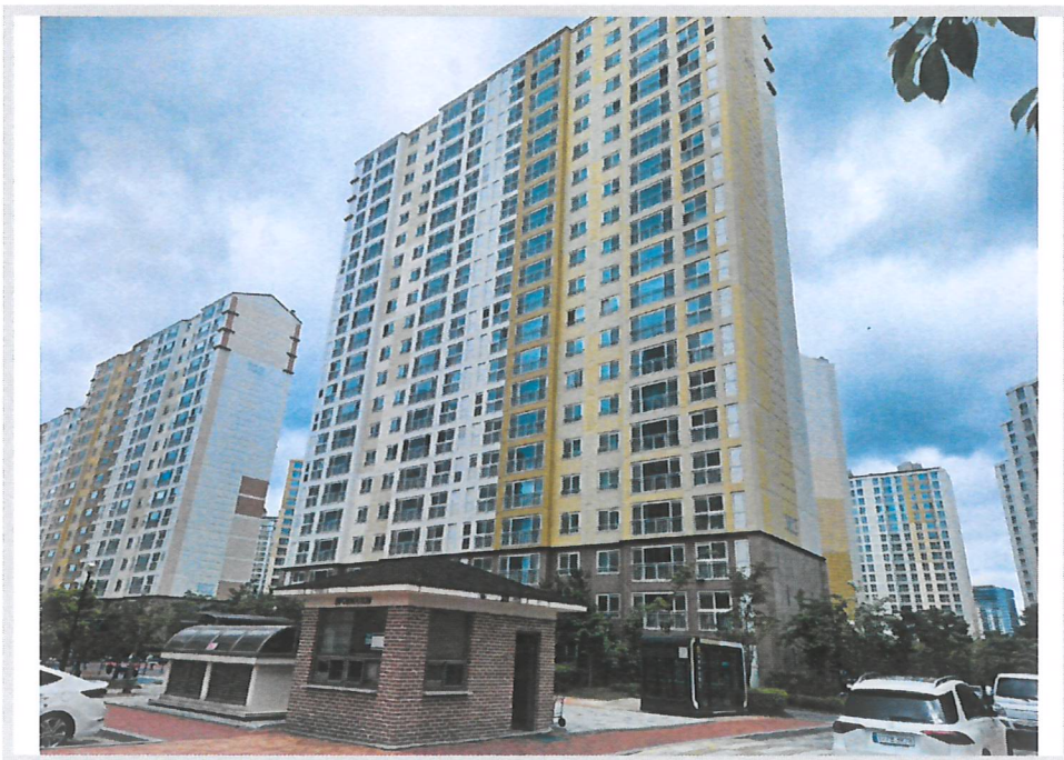
본건 제103동 전경 (남동측에서 촬영)