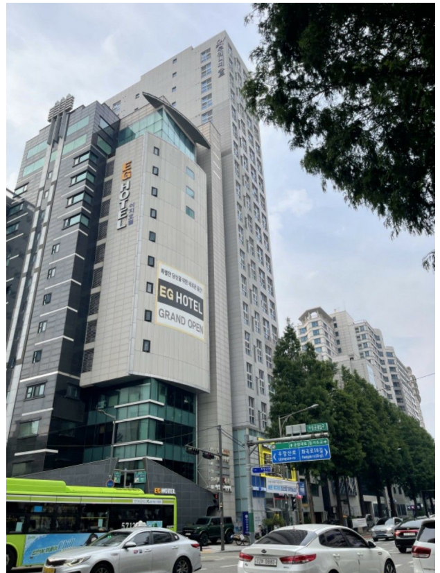
본건소재 건물 및 주위환경