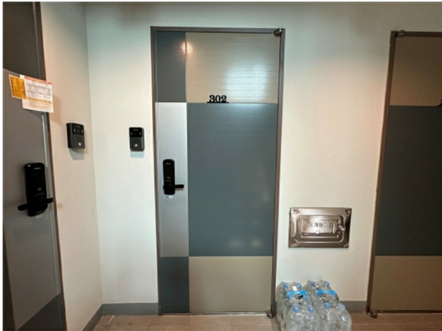
( 302 )