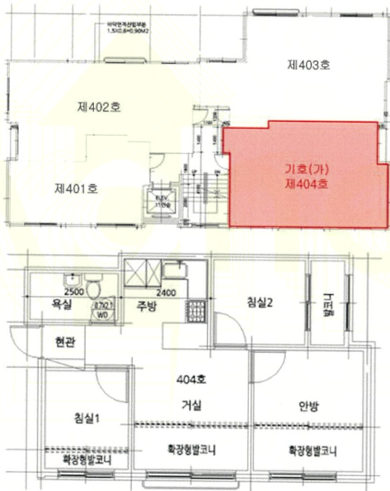
< 제4층 호별배치도 및 제404호 내부구조도 >