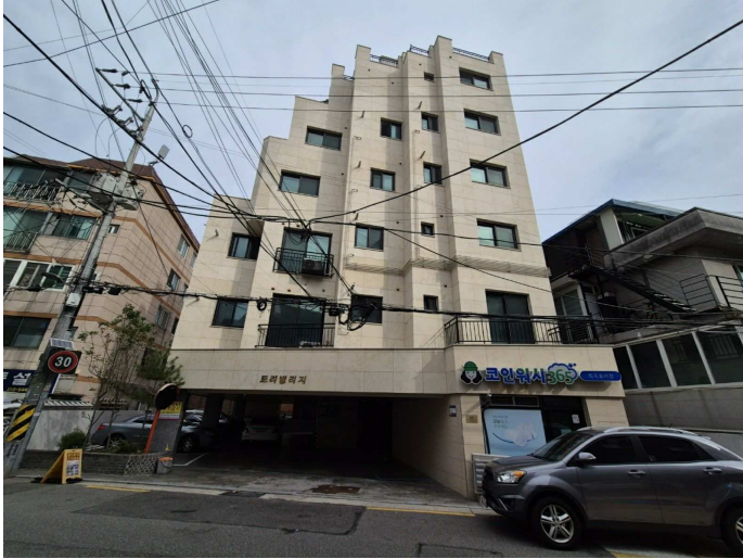
본건 건물 전경