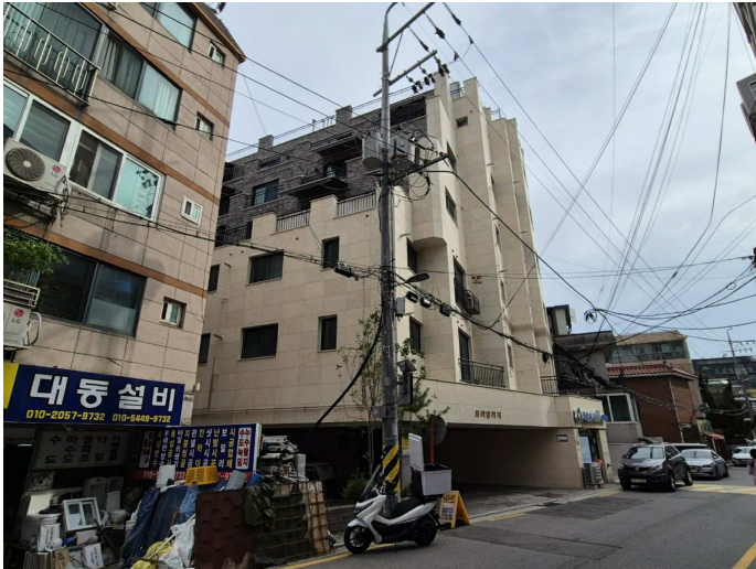
북측에서 촬영한 건물 및 주위환경