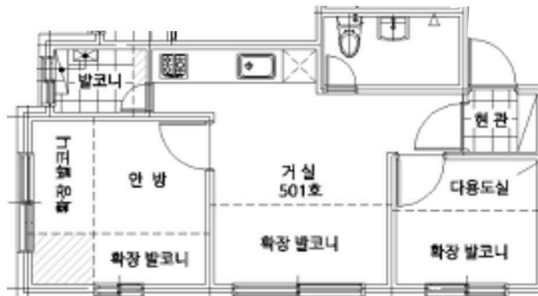
트리빌리지 제501호 (건축물현황도)