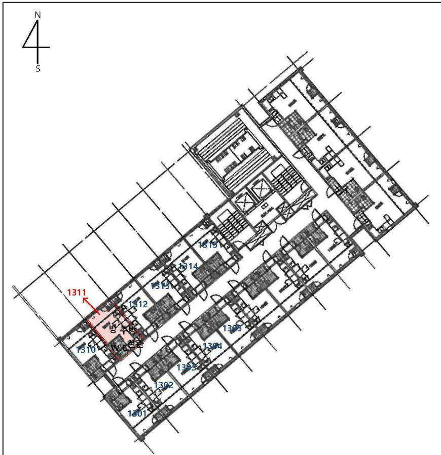
가산 양우 내안애 애플 제13층 제1311호