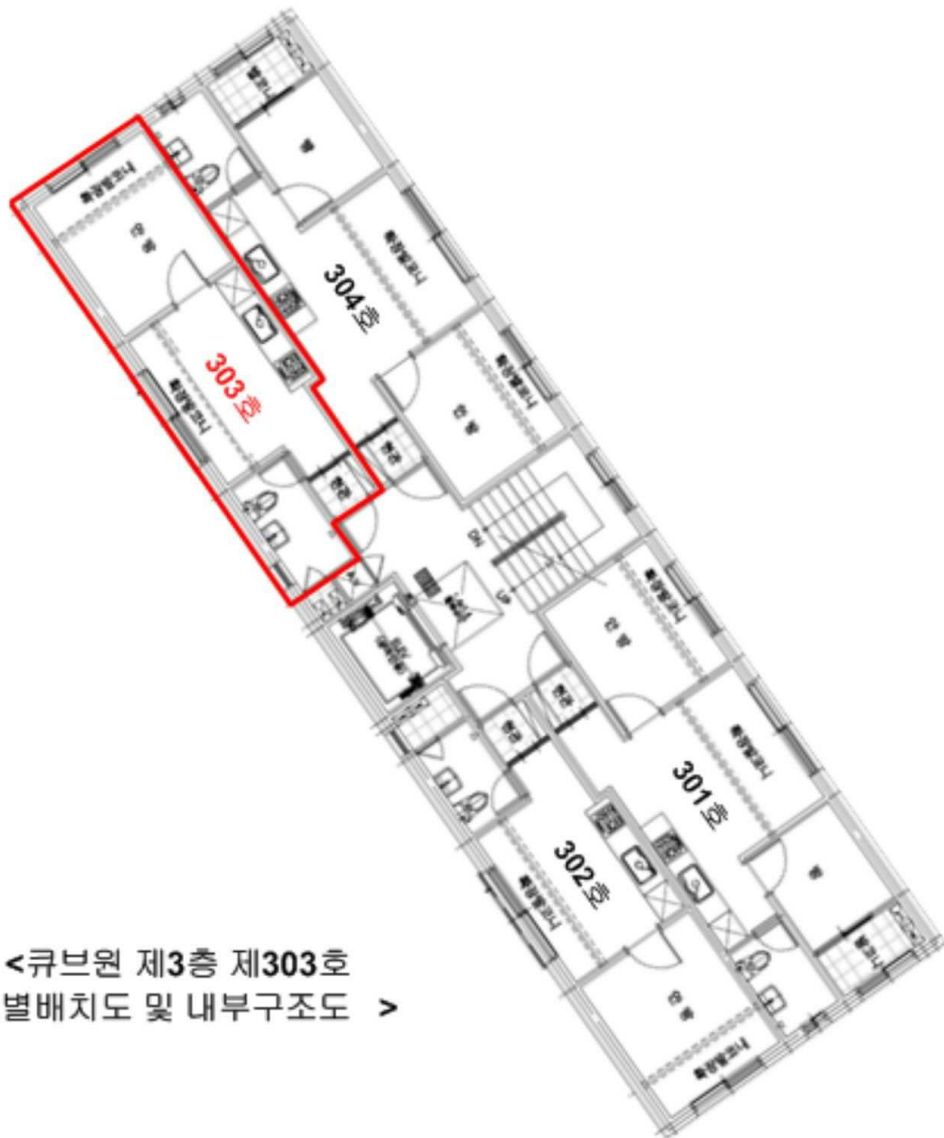
<큐브원 제3층 제303호 호별배치도 및 내부구조도 >