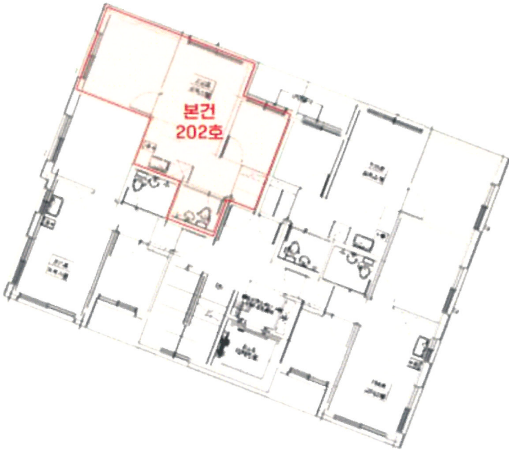
[서울특별시 강서구 화곡동 981-5 넥시티 호별배치도]