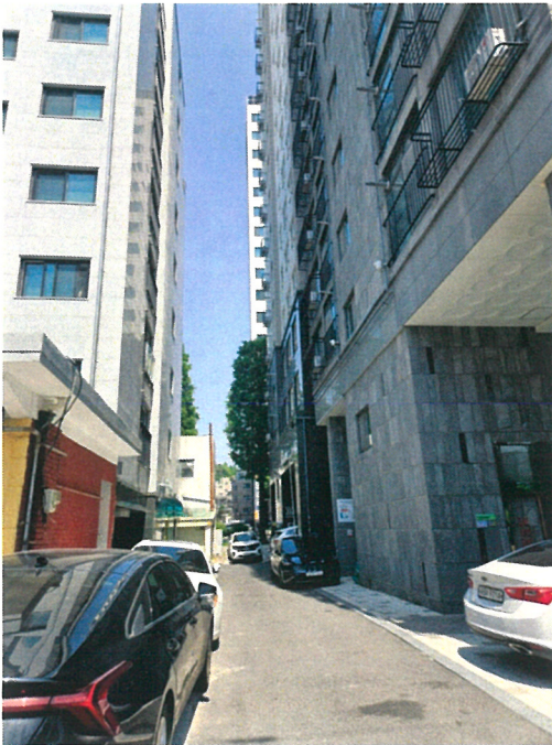
본건 및 주변 전경