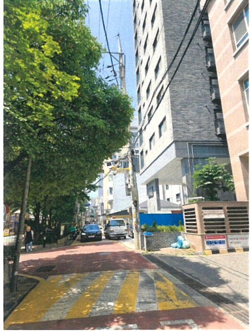
본건 및 주변 전경