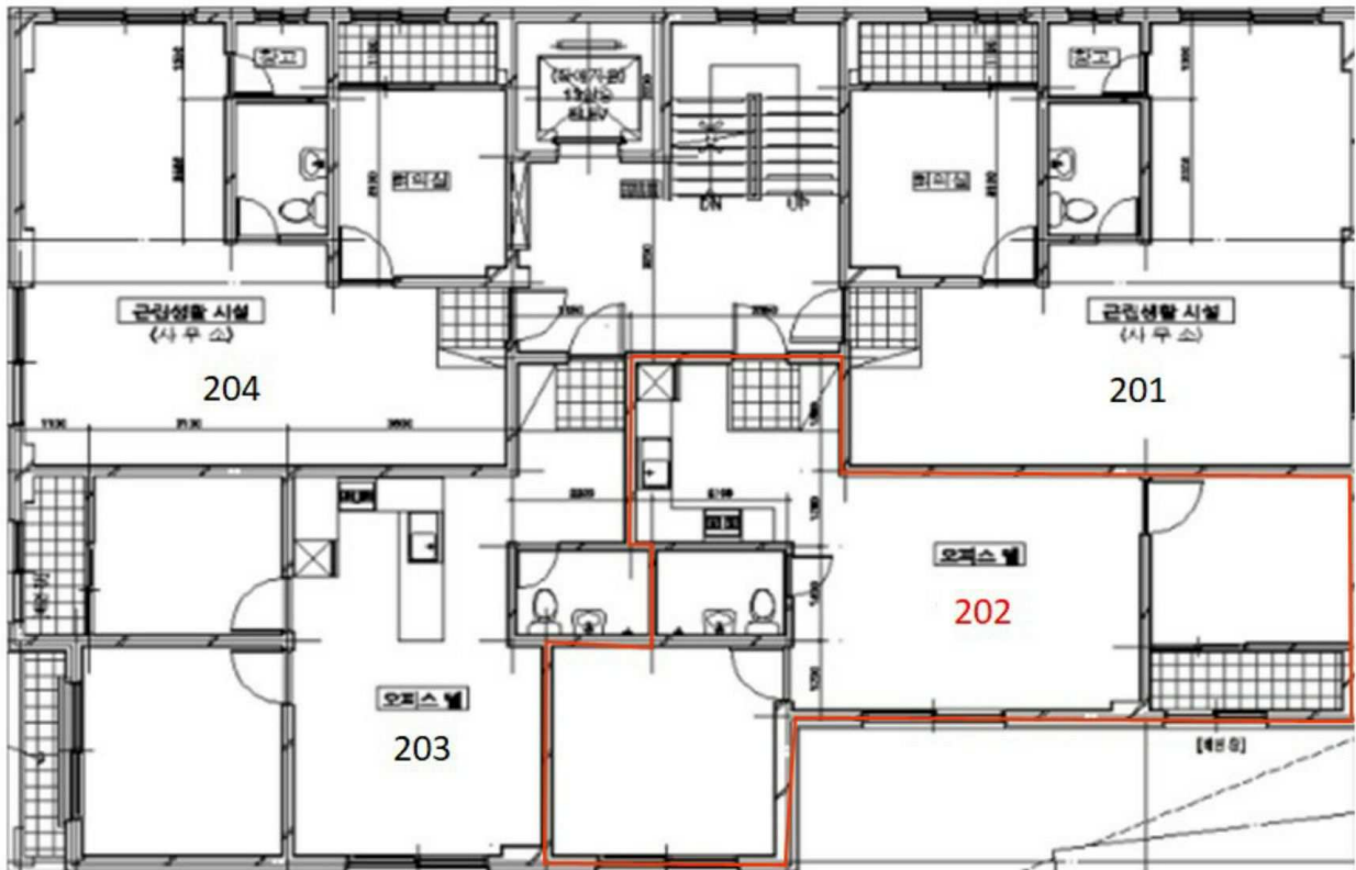
[호별배치도 및 내부구조도]