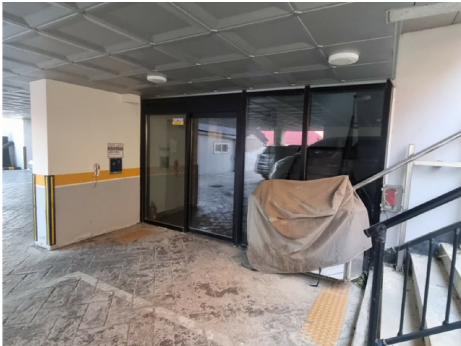
[ 1 ]