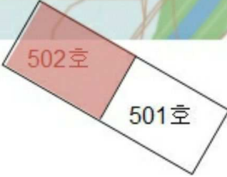
<대덕테크노밸리6단지 612동 5층 502호 >