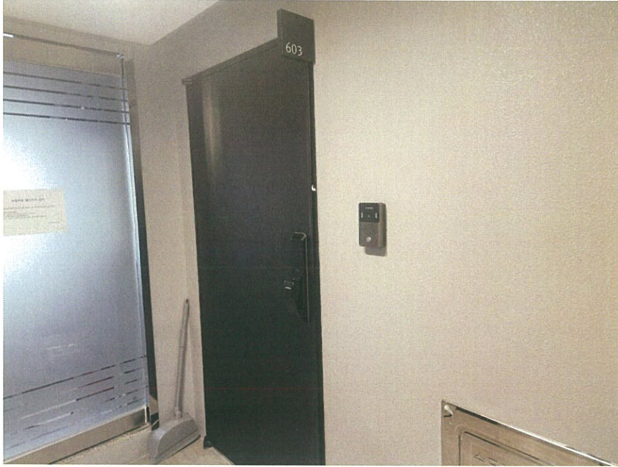
본건 호수 출입문