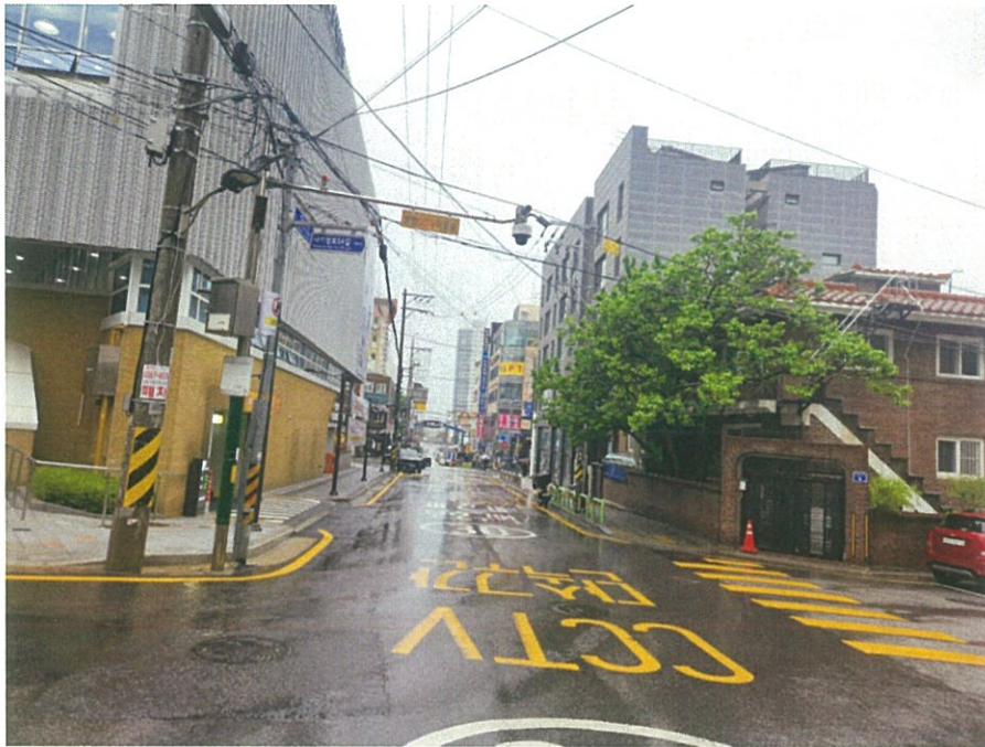
본건 및 주위환경(남서측에서 촬영)