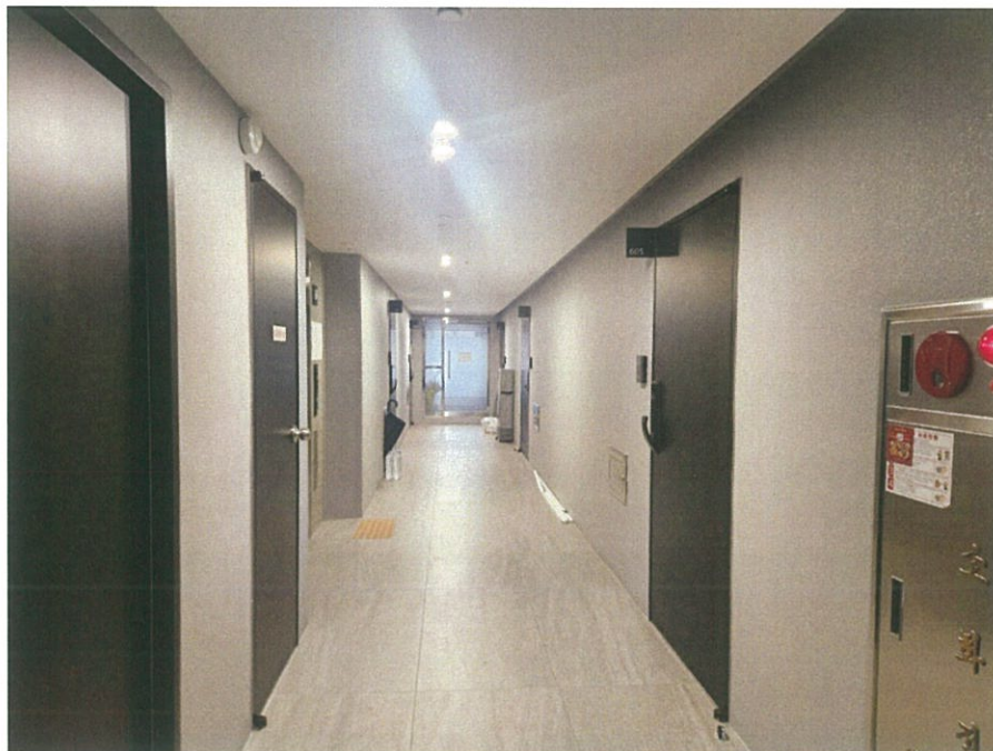
본건 층(6층) 복도 전경