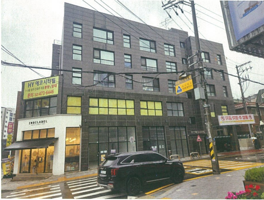
본건 건물(남측에서 촬영)