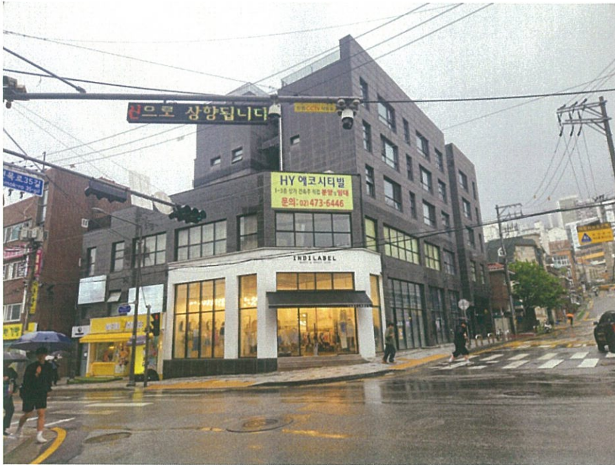
본건 건물(서측에서 촬영)