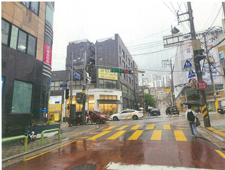
본건 및 주위환경(서측에서 촬영)