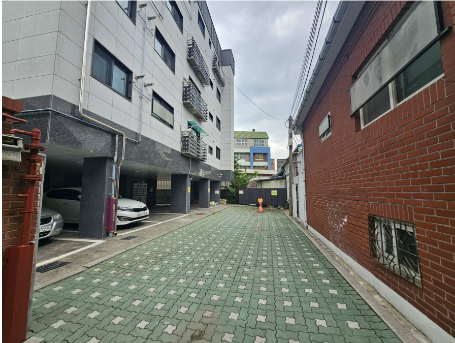
[ 주변 전경 ]