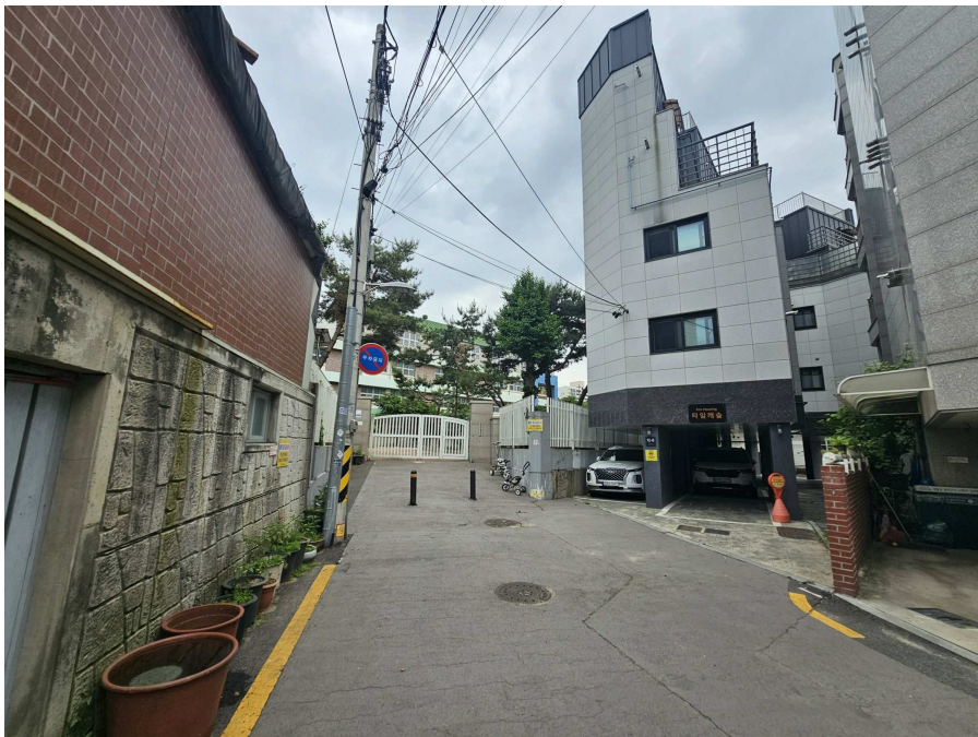
[ 주변 전경 ]