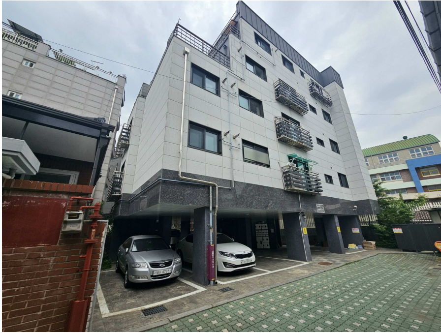
[ 본건 전경 ]