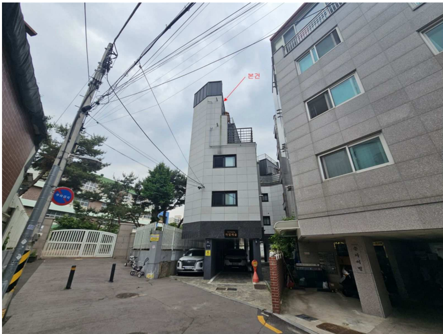
[ 본건 전경 ]